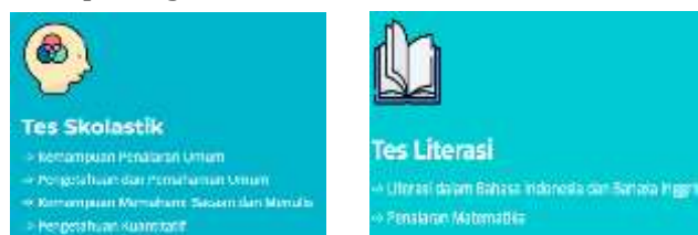
Gambar 2 Komponen di dalam UTBK-SNBT

Tim Seleksi Nasional Penerimaan Mahasiswa Baru (SNPMB) melaksanakan Seleksi masuk Perguruan Tinggi ini, yang bertanggung jawab kepada Menteri Pendidikan, Kebudayaan, Riset dan Teknologi. Dari laman SNPMB BPPP, dapat disimpulkan bahwa di dalam SNBT Tes Kemampuan Akademik atau TPA ditiadakan dengan mengusung dua komponen besar yakni Tes Potensi Skolastik (TPS) dan Tes Literasi, yang dapat terlihat pada gambar berikut: