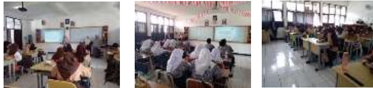
Gambar 5 Foto Kegiatan PKM, Sosialisasi dan Tes Literasi Bahasa Inggris SNBT

Kemudian, penjadwalan pelaksanaan tes dilakukan dengan menentukan kelas peminatan IPA dan IPS Kelas XII sebagai peserta tes. Pelaksanaan tes dilakukan pada hari Kamis tanggal 24 Agustus 2023 dan hari Jum'at pada tanggal 25 Agustus 2023. Berikut adalah dokumentasi kegiatan PKM tersebut: