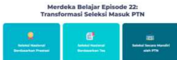
Gambar 1 Merdeka Belajar Episode 22

Di Tahun 2023 SNBT memiliki wajah baru setelah dilakukan transformasi atas instruksi Menteri Pendidikan, Kebudayaan, Riset dan Teknologi (Mendikbudristek) yang selaras dengan Merdeka Belajar Episode 22: Transformasi Seleksi Masuk Perguruan Tinggi. Adapun Posisi SNBT dapat terlihat di dalam skema perubahan Merdeka Belajar Episode 22 berikut: