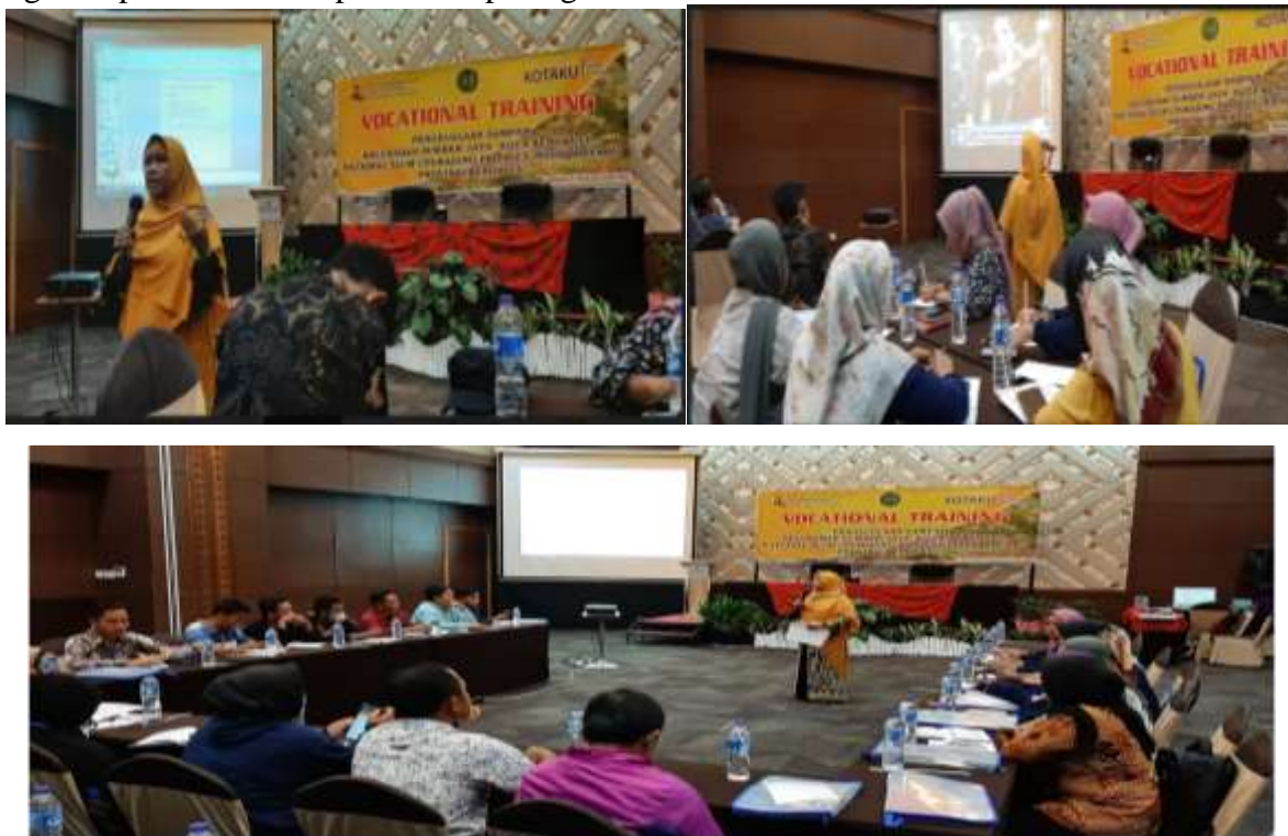
Gambar 1. Kegiatan Pelatihan

Berdasarkan hasil diskusi dan wawancara dengan para peserta, menunjukkan bahwa peserta telah memiliki pemahaman dasar tentang operasional bank sampah. Pelaksanaan kegiatan pelatihan ini dapat dilihat pada gambar 1 dan 2 .