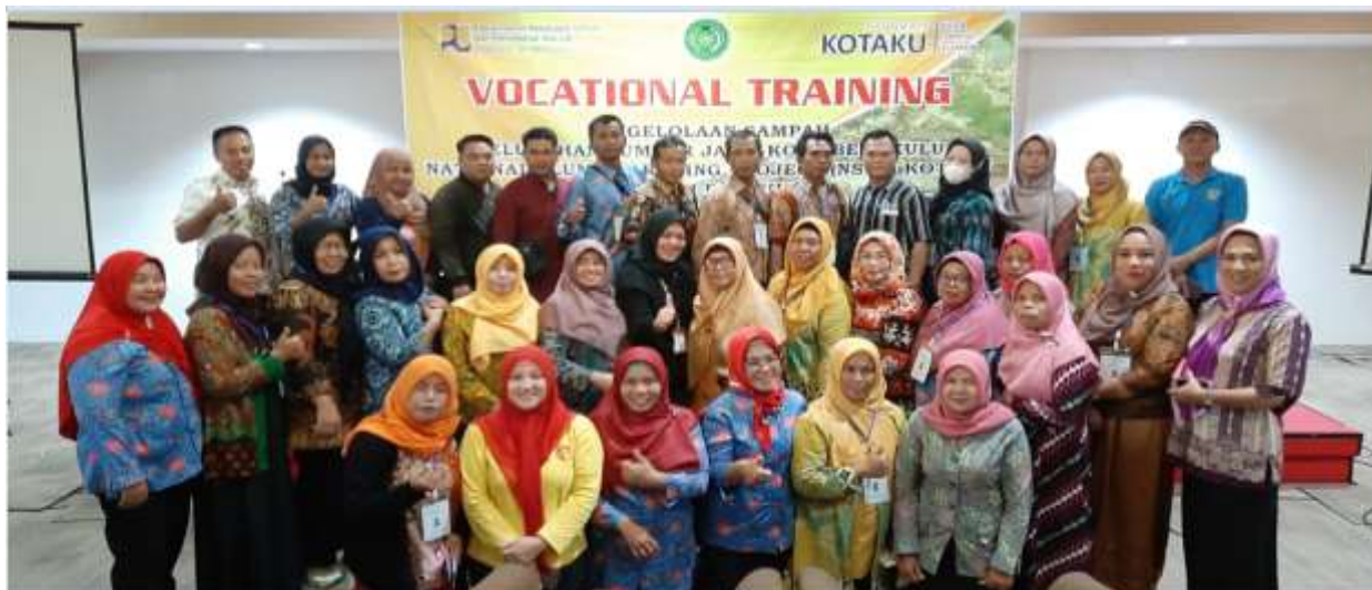
Gambar 3. Sesi Poto bersama dengan Peserta

Pemberdayaan masyarakat merupakan kegiatan yang memiliki tujuan memberdayakan masyarakat. Pemberdayaan diberikan kepada masyarakat yang tidak berdaya maupun masyarakat yang sudah memiliki daya. Pemberdayaan masyarakat dapat dikatakan berhasil apabila mereka sudah memiliki keberdayaan dan partisipasi yang baik dalam program pemberdayaan dan tujuannya ialah meningkatkan kapasitas serta kemandirian masyarakat serta memiliki kekuatan atau pengetahuan dan kemampuan untuk menanggapinya (Sunaryadi & Jasili, 2023)