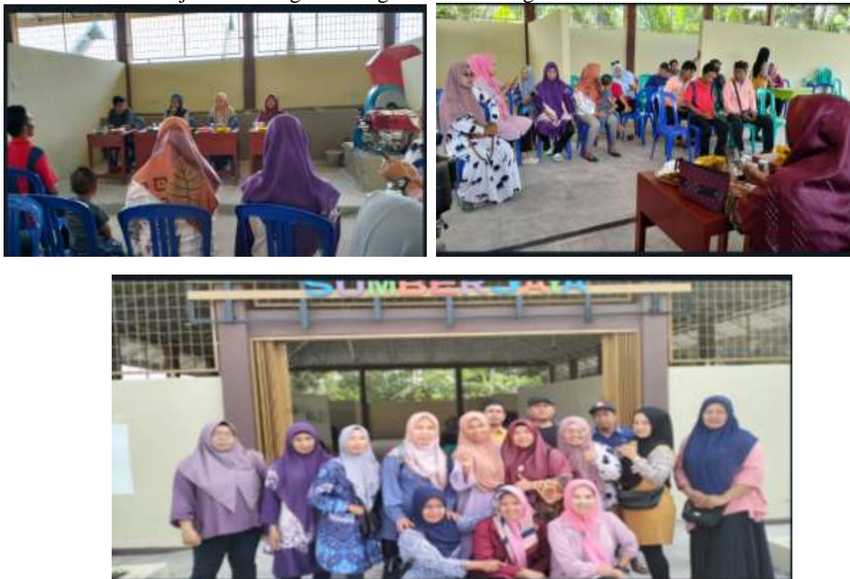
Gambar 4. Kegiatan monev tahap kedua

Kegiatan monitoring dan evaluasi tahap kedua ini merupakan lanjutan dari monev tahap pertama. Dalam kegiatan ini dilakukan koordinasi dan diskusi tentang program kerja yang akan dilaksanakan oleh Pengurus KPP TPS3R. Peremuan ini juga membahas tentang pendampingan oleh pihak LPPM UMB dalam hal pengolahan sampah organik dan anorganik. Gambar berikut menjelaskan rangkaian kegiatan di Gedung TPS3R.