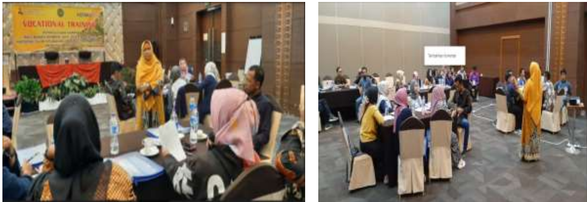
Gambar 2. Workshop