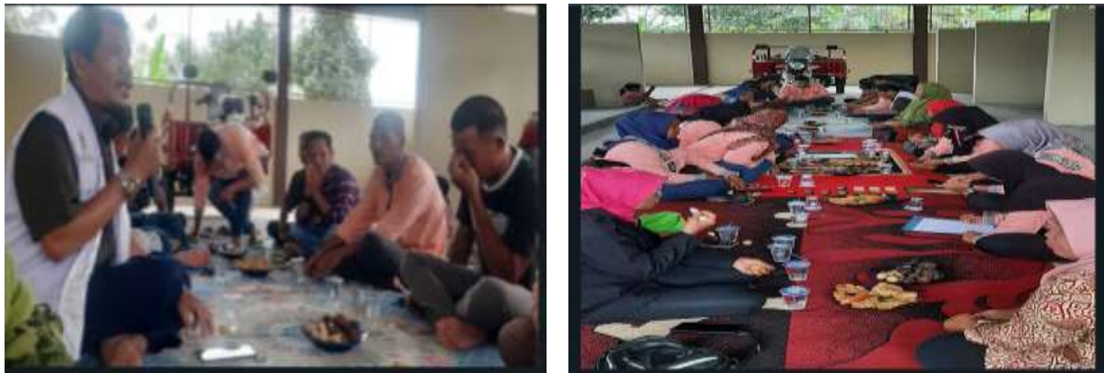
Gambar. 3. Monev pertama di Gedung TPS3R