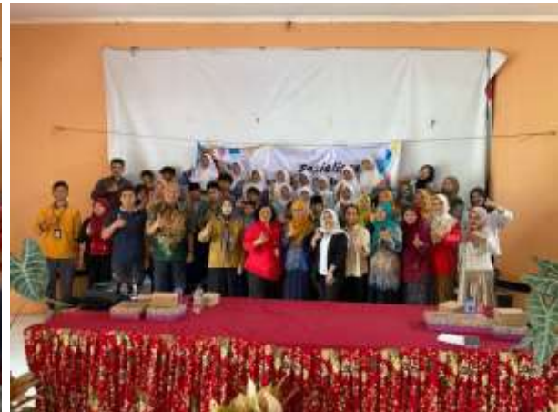
Gambar 6. Seluruh Peserta an pemateri