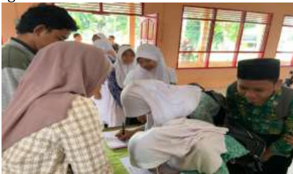
Gambar 1. Peserta mulai memasuki ruangan