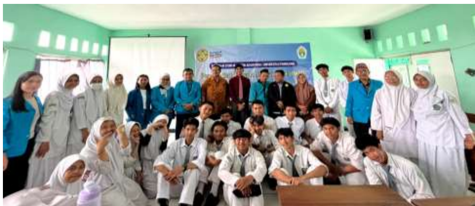
Gbr 4. Apresiasi kepada Partisipan

Para siswa sangat antusias dan bersemangat ketika mendapatkan pelajaran baru mengenai pajak. Meskipun materi ini mungkin sesuatu hal yang baru, namun materi yang diberikan membuka wawasan dan menambah pengetahuan bagi mereka. Dengan pendekatan yang menarik, siswa-siswi menjadi lebih memahami materi tersebut dengan mudah. Sebagai bentuk penghargaan atas antusiasme dan partisipasi aktif para siswa selama kegiatan sosialisasi, tim PKM memberikan apresiasi.