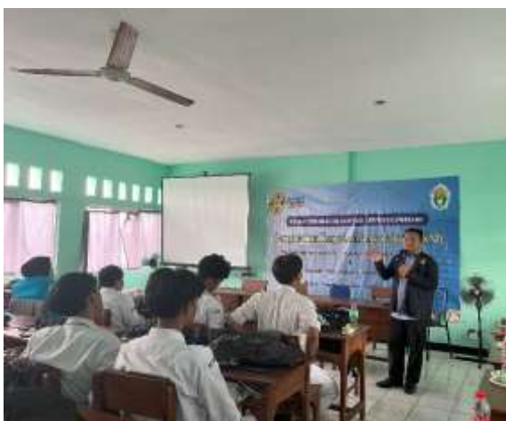
Gbr 2. Arahan Dosen Pendamping