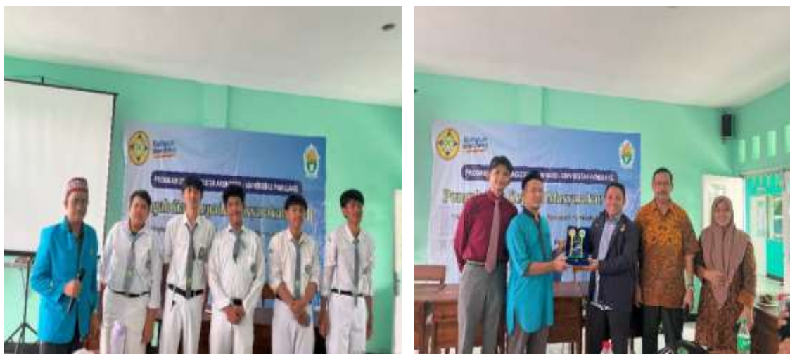
Gambar 4. Penyampaian Materi Akhir dan Edugame

Para siswa sangat antusias dan bersemangat ketika mendapatkan pelajaran baru mengenai pajak. Meskipun materi ini mungkin sesuatu hal yang baru, namun materi yang diberikan membuka wawasan dan menambah pengetahuan bagi mereka. Dengan pendekatan yang menarik, siswa-siswi menjadi lebih memahami materi tersebut dengan mudah. Sebagai bentuk penghargaan atas antusiasme dan partisipasi aktif para siswa selama kegiatan sosialisasi, tim PKM memberikan apresiasi.