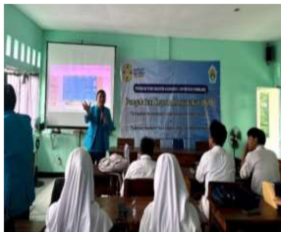
Gbr 3. Penyampaian Materi Awal

Mengapa penting untuk memahami pajak? Budaya kesadaran pajak sebaiknya ditanamkan sejak dini melalui pendidikan untuk membentuk karakter generasi bangsa yang mencintai tanah air dan memahami pentingnya memenuhi hak dan kewajiban. Pajak adalah kontribusi yang harus diberikan kepada negara oleh individu atau badan secara wajib berdasarkan hukum, tanpa imbalan langsung, dan digunakan untuk keperluan negara guna meningkatkan kesejahteraan rakyat. Pendidikan tentang pajak tidak hanya penting bagi mereka yang sudah menjadi wajib pajak saat ini, tetapi juga harus diberikan kepada siswa sebagai wajib pajak di masa depan. Melalui sosialisasi konsep pajak sebagai upaya gotong royong dari seluruh masyarakat Indonesia, diharapkan dapat mewujudkan kesejahteraan bagi seluruh rakyat.