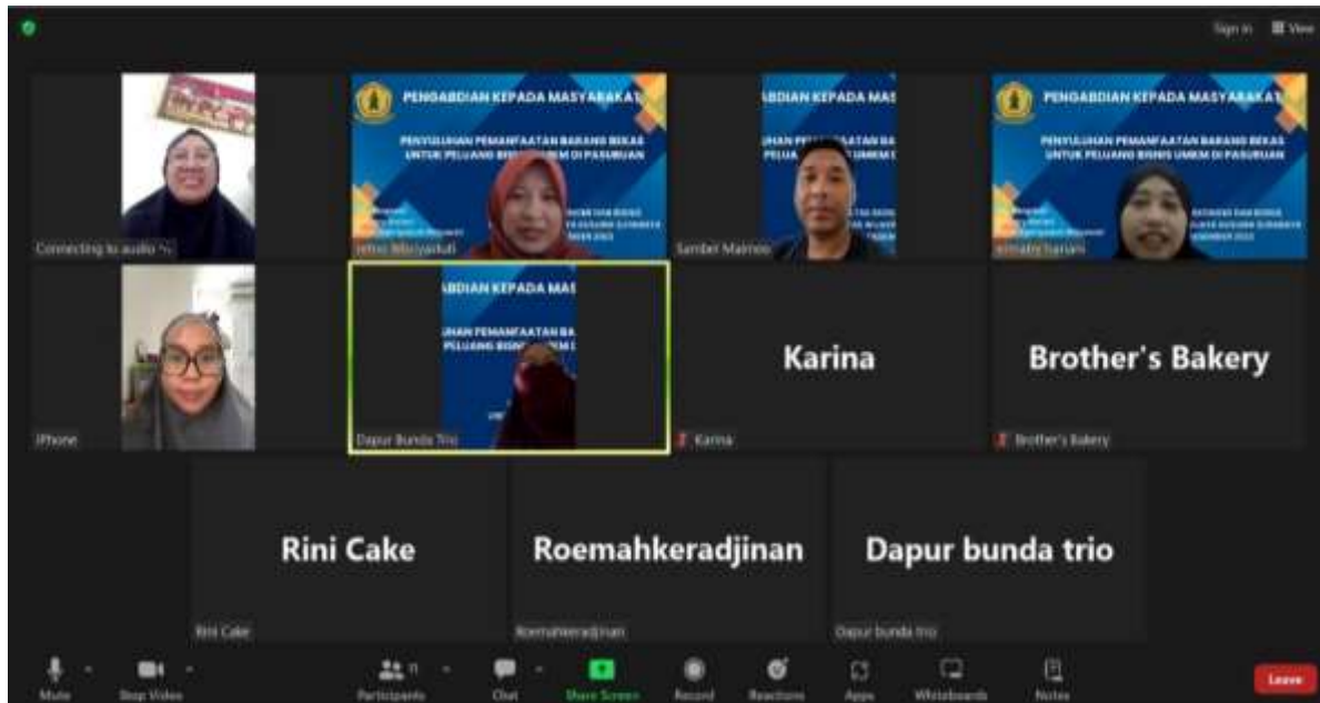
Gambar. 2 Sesi Tanya Jawab dengan Pelaku UMKM