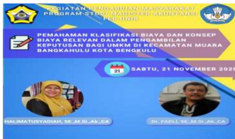
Gambar 1. Flyer Kegiatan pengabdian