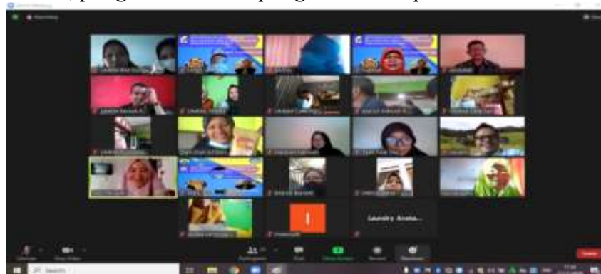
Gambar 6. Foto Bersama tim pengabdian dengan peserta

Pelaksanaan kegiatan ini, tidak ada faktor penghambat yang berarti, sinyal internet juga lancar, sehingga kegiatan ini bisa berjalan sebagaimana yang diharapkan. Khalayak sasaran sangat berharap kegiatan ini dapat dilanjutkan dalam bentuk pendampingan dan dan pengetahuan yang lebih dalam tentang klasifikasi biaya dan teknik analisisnya sehingga menjadi informasi yang sangat bermanfaat bagi mereka dalam perencanaan, pengendalian dan pengambilan keputusan.