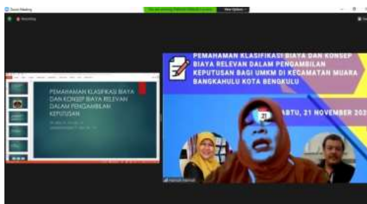
Gambar 2. Penyampain oleh tim pengabdian

Materi berikutnya adalah menyampaikan beberapa contoh kasus dalam mengambil keputusan yang membutuhkan informasi biaya relevan. Contoh-contoh kasus tersebut adalah berkaitan dengan keputusan membuat atau membeli, keputusan