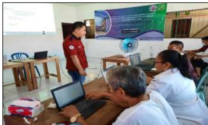
Gambar 7. Antusias Peserta Mengikuti Sesi Menjawab Pertanyaan Materi

Setelah penyampaian materi, diadakan sesi tanya jawab. Pada bagian ini dilakukan pemberian pertanyaan dari tim pelaksana kepada peserta mengenai materi yang telah disampaikan oleh tim pelaksana. Antusias peserta yang ikut berpartisipasi dalam sesi pertanyaan materi seperti pada Gambar 7.