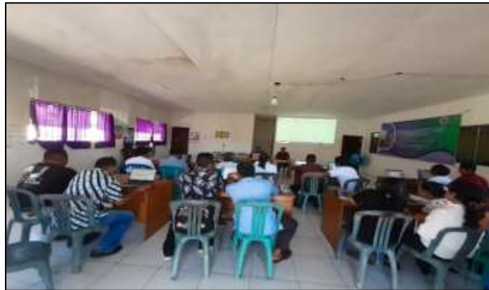
Gambar 5. Penyampaian Materi dari Dosen STMIK Palangkaraya

Penyampaian materi, demonstrasi, dan praktik yang dilakukan, ditanggapi antusias dari para peserta. Hal ini tampak seperti pada Gambar 6.