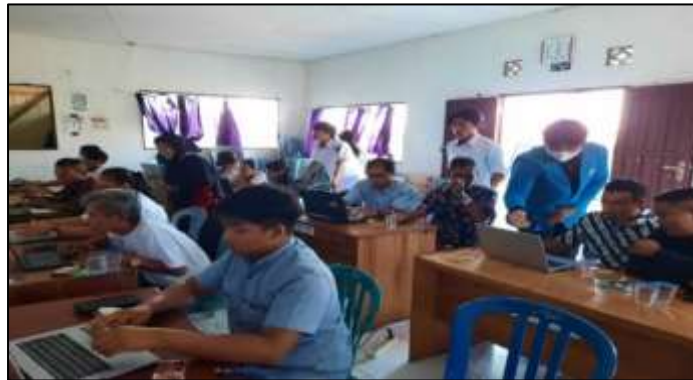
Gambar 6. Antusias Peserta Mengikuti Kegiatan

Penyampaian materi, demonstrasi, dan praktik yang dilakukan, ditanggapi antusias dari para peserta. Hal ini tampak seperti pada Gambar 6.