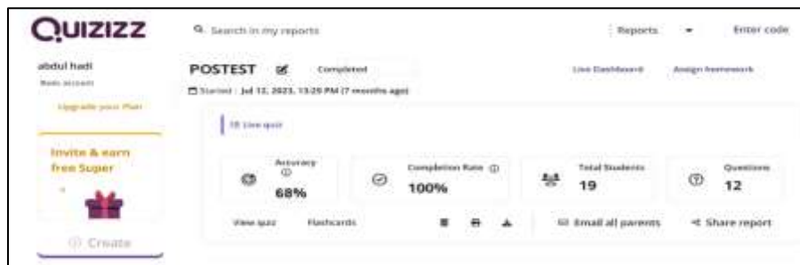
Gambar 8. Hasil Posttest

Di akhir sesi kegiatan, dilakukan posttest , untuk mengetahui hasil perbedaan yang signifikan. Pertanyaan yang diberikan kepada peserta sama dengan pertanyaan pada pretest . Hasil penilaian pada posttest seperti pada Gambar 8.