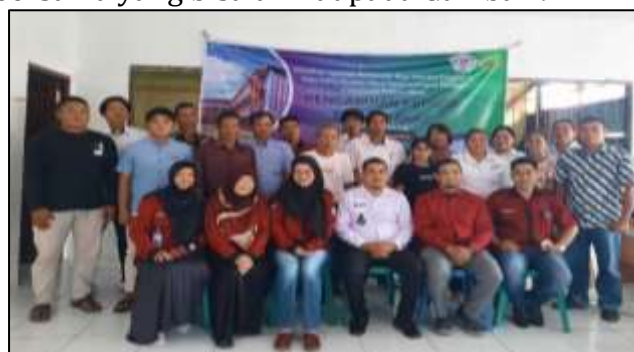
Gambar 9. Foto Bersama Kepala Desa Bahu Palawa, Tim PKM, dan Peserta

Berdasarkan pada Tabel 1 dapat disimpulkan bahwa dari hasil pretest dan posttest menunjukkan adanya peningkatan pemahaman oleh para peserta. Pelaksana pengabdian memberikan link kuesioner berupa google form yang dibagikan secara langsung kepada peserta pada akhir kegiatan. Hasil kuesioner selanjutnya diolah melalui analisis deskriptif. Analisis deskriptif memiliki tujuan untuk mengetahui tanggapan dan karakteristik dari responden terhadap beberapa item pernyataan dalam sebuah kuesioner. Responden pada kuesioner ini adalah peserta kegiatan PKM dengan jumlah 17 responden mengisi kuesioner dengan pendidikan terakhir S1 29,4%, SMA 64,7%, SMP 5,9% yang diadakan pada hari Rabu, 12 Juli 2023. Sebelum acara berakhir, dilakukan sesi foto bersama yang bisa dilihat pada Gambar 9.