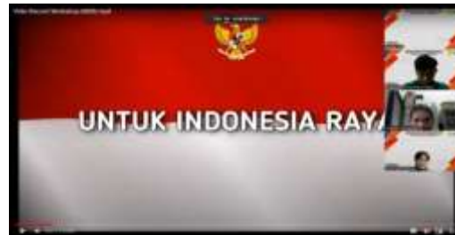
Gambar 2. Menyanyikan Lagu Indonesia Raya

Dalam kegiatan ini, peserta terdiri dari kalangan Mahasiswa dan Masyarakat Umum dengan jumlah 100 peserta. Peserta mengikuti kegiatan dan mengisi form kuesioner webinar dan workshop berjumlah 100 orang. Kegiatan ini dilaksanakan sesuai dengan jadwal pada tanggal Jumat, 26 Januari 2024 pada pukul 08.00 – 11.35. Acara dimulai dengan pembukaan yang dibawakan oleh MC, dilanjutkan dengan pembacaan tilawah dan menyanyikan lagu Indonesia raya pada Gambar 1.