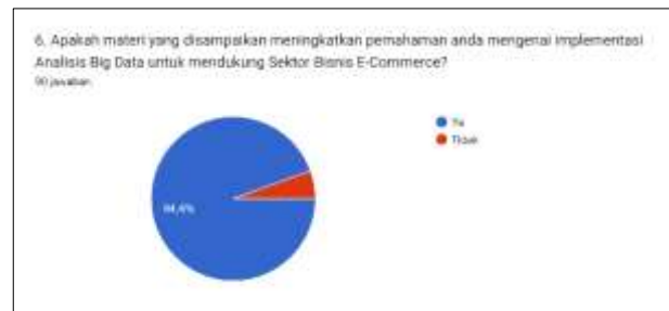
Gambar 11. Tanggapan pertanyaan 5

Dari hasil kuesioner di atas, terlihat bahwa pembawaan materi webinar dan workshop yang diberikan sudah sesuai dengan apa yang diharapkan oleh peserta dan penyampaian materi yang mudah dipahami oleh peserta.