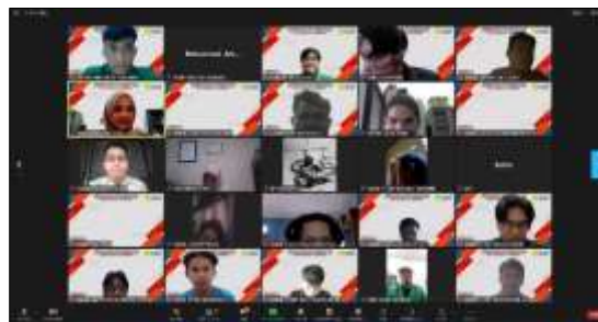
Gambar 6. Foto Bersama

Lalu kegiatan diakhiri dengan sesi foto Bersama dapat dilihat pada Gambar 5. Sesi foto bersama adalah sesi terakhir dalam rangkaian kegiatan acara sekaligus sebagai dokumentasi kegiatan.