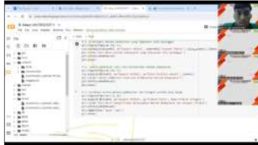
Gambar 5. Sesi 3

Dilanjutkan pada sesi 3, yaitu workshop yang dipandu oleh pemateri Muhammad Farizs Hakim seperti ditunjukkan pada Gambar 4. Pada sesi ini, pemateri akan melakukan live code mengenai bagaimana mengelola dataset atau data preprocessing, serta memvisualisasikan dataset terkait personalisasi layanan, deteksi pola dan tren, serta analisis perilaku pengguna, khususnya di sektor E-Commerce.