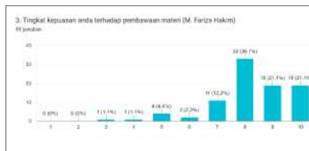
Gambar 9. Tanggapan pertanyaan 3