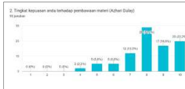
Gambar 8. Tanggapan pertanyaan 2

Dengan hasil tingkat kepuasan 32,2% orang memberikan nilai 8, 18,9% orang memberikan nilai 9, 22,2% memberikan nilai 10.