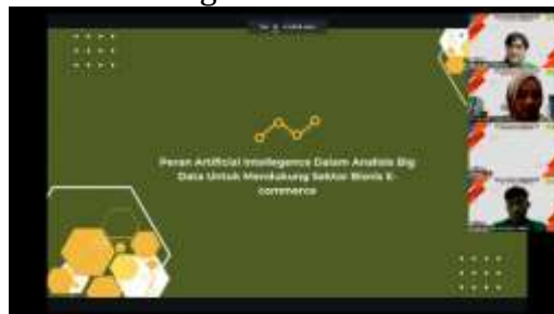
Gambar 3. Sesi 1

Dilanjutkan dengan pelaksanaan kegiatan seperti ditunjukkan pada Gambar 2. Pelaksanaan kegiatan diawali dengan dimulainya sesi 1 dan dibawakan oleh pemateri 1 yaitu Fikram Althaf Muyassar yang membahas mengenai Peran Artificial Intelligence Dalam Analisis Big Data Untuk Mendukung Sektor Bisnis E-commerce.