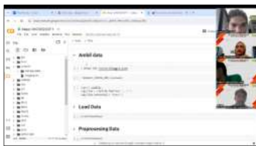
Gambar 4. Sesi 2

Kemudian acara dilanjutkan di sesi 2 yang dibawakan oleh pemateri 2 yaitu Azhari Daulay seperti ditunjukkan pada Gambar 3. Pada sesi ini pemateri akan melakukan live code dengan pembahasan tentang exploring data science berisi paparan materi bagaimana penggunaan bahasa pemrograman Python untuk data science, pengenalan data science, pengenalan library Python, dan diberikan paparan contoh kasus penggunaan Python dalam Analisis Big Data Untuk Mendukung Sektor Bisnis E-commerce.