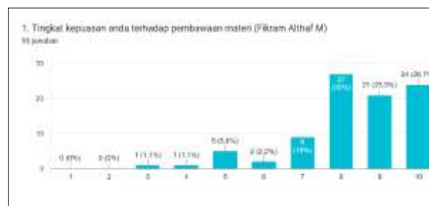
Gambar 7. Tanggapan pertanyaan 1