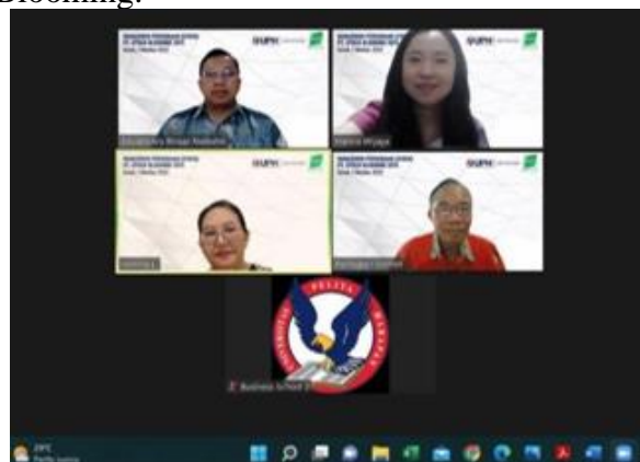
Gambar 1. Tim PKM FE. UPH

Menyiapkan materi pelatihan, dan pertanyaan serta soal latihan. Materi mencakup pengertian dan ciri usaha toys, karakteristik persediaan toys, sistem percaatan perseediaan dengan perpetual dan periode. Metode pencatatan, pricing, metode penilaian, cara mengurangi kecurangan atau barang hilang dari toko atau gudang, dan meningkatkan penjualan. Peserta mencoba menjawab pertanyaan Tim PKM tentang proses kerja manajemen persediaan. Kemudian tim PKM menjelaskan dan memperbaiki jawaban yang perlu diperbaiki. Dengan cara ini penguatan peserta makin bertambah dan akibatnya kesalahan pun akan dapat dicegah atau dikurangi di masa yang akan datang. Proses pembelajaran aktif yang dilakukan dengan dialogis dan sesuai konteks praktek di lapangan telah membukakan wawasan karyawan PT.Epoch Blooming.