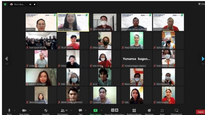
Gambar 2. Berlangsungnya PKM

Setelah selesai pelatihan, maka para peserta melakukan diskusi kelompok cara melakukan stock opname dan membuat pelaporan persediaan. Laporan meliputi waktu stock opname, tempat/toko yang stock opname, sisa barang menurut catatan dan menurut fisik dicocokkan. Jika ada perbedaan dicari perbedaan dan alasannya. Setelah semua peserta siap melakukan simulasi maka tim pengabdian melakukan penilaian atas simulasi real assessment, membahas hasil akhir simulasi real assesment dan umpan balik pada peserta.