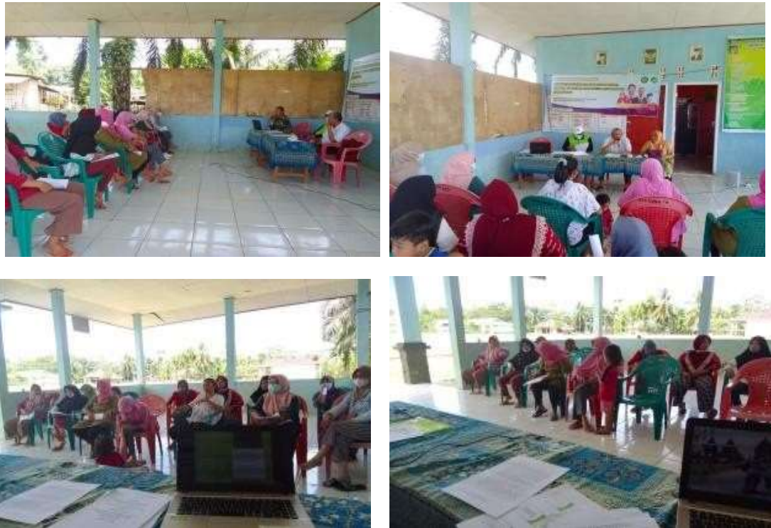
Gambar 1. Dokumentasi Kegiatan Pengabdian

Berikut disajikan dokumentasi kegiatan pengabdian di desa Padang Kuas Kecamatan Sukaraja Kabupaten Seluma.