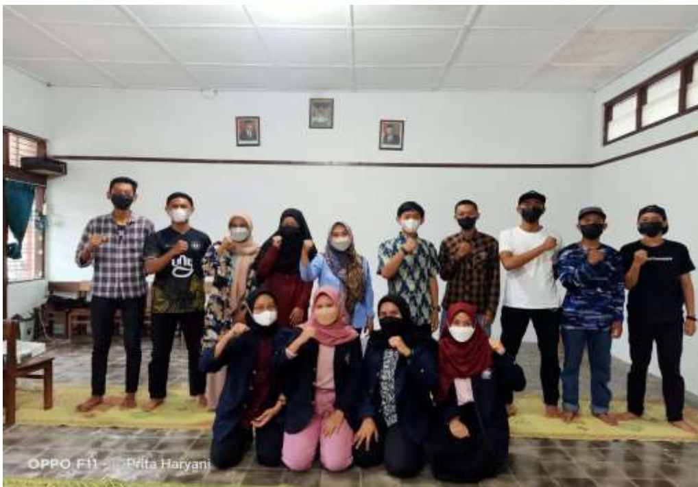
Gambar 4. Foto Bersama Peserta Pelatihan dengan Nara Sumber

Pada tahap evaluasi dilakukan dengan peserta pelatihan mengisi umpan balik pada form kepuasan kuesioner mitra. Berikut adalah hasil penilaian mitra/peserta pelatihan pada tabel 1.