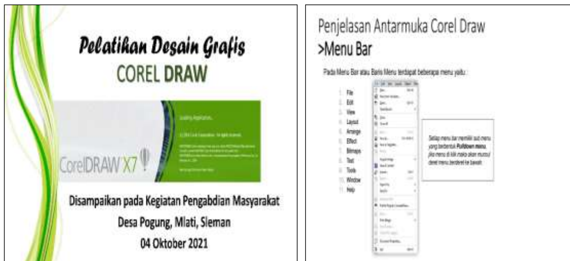
Gambar 2. Materi Pelatihan PkM

Pelaksanaan kegiatan abdimas dilaksanakan dengan memberikan pelatihan desain grafis kepada 13 pemuda pemudi / remaja di Desa Pogung Dalangan RT 10 RW 50 Sumberadi Mlati Sleman. Materi kegiatan Pengabdian Kepada Masyarakat ini disusun berdasarkan kebutuhan pemuda pemudi Dalangan. Materi pelatihan meliputi pengenalan menu pada Aplikasi Corel Draw dan praktik langsung membuat flyer informasi kegiatan. Penjelasan materi oleh narasumber menggunakan metode ceramah kemudian dilakukan audiensi tanya jawab dan praktik oleh peserta pelatihan.