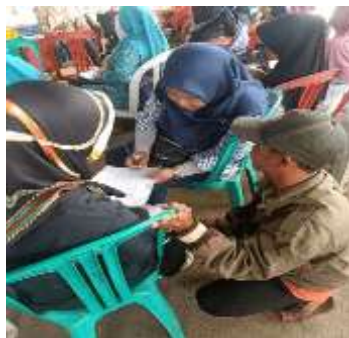
Gambar 3 Identifikasi Kebutuhan Warga Terdampak Bencana

Berdasarkan hasil identifikasi oleh aparat Desa Nagrak dan investigasi oleh Tim PKM Universitas Persada Indonesia YAI, terpilih warga yang terdampak parah. Tim kemudian mengundang warga untuk mengidentifikasi kebutuhan barang modal darurat yang diperlukan untuk segera bangkit dari keterpurukan (Gambar 3).