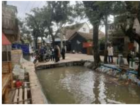
Gambar 6 Usaha perikanan Karang taruna

Berdasarkan identifikasi kerusakan dan kebutuhan, karang taruna juga menerima bantuan barang modal. Meskipun tidak seberapa dibandingkan dengan kebutuhan yang diperlukan, namun bantuan ini juga sangat membantu. Barang modal yang diserahkan antara lain; indukan, jaring, dan makanan ikan. Hasil dari perikanan yang dikelola karang taruna ini diharapkan mampu mendanai kegiatan pemuda sehingga bisa mengurangi kriminalisasi dan kejahatan. Dampak sosial positif dan menghasilkan uang.