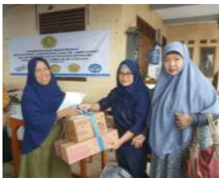
Gambar 7 Penyerahan barang modal usaha bagi warga terdampak bencana

Sementara untuk warga terkena dampak, Program kemandirian masyarakat UPI YAI juga memberikan bantuan kepada pedagang kecil yang berjualan keliling, penjual gorengan, bubur maupun berjualan pop-ice (Gambar 7). Bantuan berupa peralatan sesuai dengan kebutuhan mereka, sehingga tepat guna. Sehingga bantuan yang diberikan kepada korban bencana Cianjur ini bisa bermanfaat bagi sektor usaha kecil lainnya.