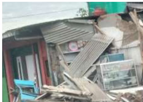
Gambar 1 Usaha kecil terdampak bencana

Usaha dan hasil pertanian lenyap, tempat tinggal hilang, alat produksi hancur dan kegiatan ekonomi berhenti (gambar 1). Kehidupan masyarakat kecil makin terhimpit, dan pastinya mereka tidak memiliki asset, apalagi tabungan. Inilah pentingnya memiliki asset komunal bagi rakyat miskin (Purwastuty, 2018). Tetangga dan saudara menjadi andalan, yang juga sangat terbatas. Sangat sulit untuk bangkit dan usaha lagi karena barang modal hancur.