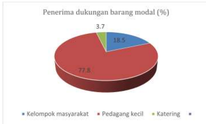
Gambar 8 Sebaran penerima dukungan barang modal

tidak hanya mengandalkan bantuan untuk kebutuhan sehari hari. Meskipun masih di tenda penampungan, diharapkan warga sudah bisa langsung beraktifitas kembali.