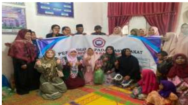
Gambar 4. Tim Pengabdi bersama dengan sebagian Mitra

tepat waktu dan materi adalah hal baru. Hal ini karena di Desa Gunung Bahgie sebelum ini belum pernah ada kelompok atau Tim Pengabdi yang datang untuk mengadakan program di Desa tersebut. Adapun hasil penilaian evaluasi ditunjukkan pada Gambar 2 di atas.