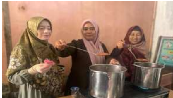
Gambar 2. Tim Pengabdian yang melakukan demonstrasi pengolahan saus cabai

Pada sesi Tanya-jawab ini, Mitra ada bertanya mengenai daya tahan saus cabai, penyimpanan dan pengemasan. Secara umum, narasumber menyampaikan dengan singkat, karena waktu yang tidak mencukupi. Sesi demonstrasi dilakukan juga menggunakan cabai segar yang sudah disortasi, dicuci bersih dan sudah dihaluskan. Namun narasumber menjelaskan hal ini kepada semua Mitra.