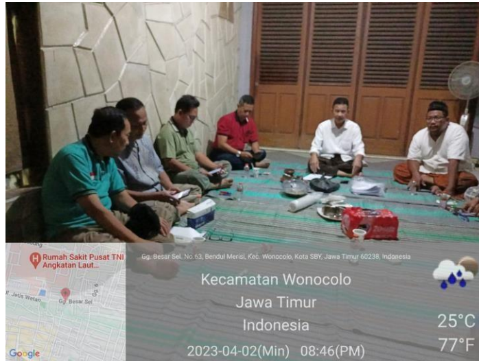
Gambar 1. penjangingan calon warga jurnalis

Dalam langkah persiapan, tim menentukan kriteria calon jurnalis warga, mengadakan survey dan penjajagan sejauh mana pemahaman pemuda terkait jurnalisme warga dan pengaruh jurnalisme warga terhadap peningkatan pelayanan publik dan melakukan penjangingan calon jurnalis warga.