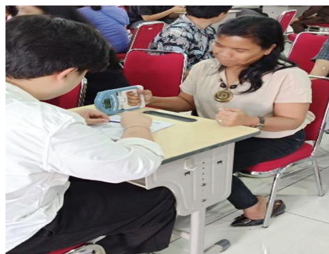
Gambar 1. Pengukuran Kekuatan Genggam Tangan pada Partisipan

Kegiatan pengabdian masyarakat ini diselenggarakan di Sekolah Mutiara Bangsa dengan sasaran populasi dewasa ( \geq 18 tahun) yang bersedia mengikuti rangkaian skrining dan edukasi kesehatan. Program difokuskan pada penapisan kekuatan genggam tangan sebagai indikator awal risiko sarkopenia, dengan tujuan promotif dan preventif untuk meningkatkan kesadaran masyarakat tentang pentingnya menjaga kesehatan otot, mencegah penurunan kapasitas fisik, dan mendukung kualitas hidup jangka panjang. Pelaksanaan kegiatan mengikuti kerangka Plan-Do-Check-Act (PDCA) untuk memastikan pendekatan yang sistematis, terukur, dan berkelanjutan. (Gambar 1)