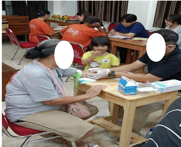
Gambar 1. Pengambilan Darah Vena pada Partisipan

diintegrasikan dengan pemberian edukasi untuk meningkatkan pemahaman masyarakat mengenai faktor penyebab anemia, implikasi klinisnya, serta urgensi deteksi dini dalam menjaga kapasitas fungsional dan kualitas hidup. Seluruh pelaksanaan kegiatan disusun dan dievaluasi dengan menggunakan kerangka Plan-Do-Check-Act (PDCA) guna menjamin keterlaksanaan program secara terstruktur dan berkesinambungan. (Gambar 1)