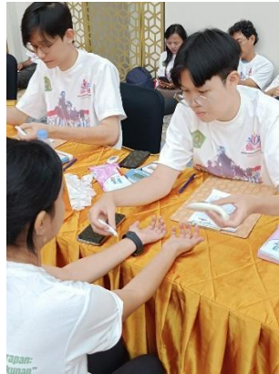
Gambar 1. Pemeriksaan Kadar Air, Minyak dan Hidrasi Kulit pada Peserta

Tahap perencanaan diawali dengan identifikasi permasalahan kesehatan kulit yang umum dijumpai pada populasi dewasa, khususnya gangguan keseimbangan hidrasi kulit dan produksi sebum yang dipengaruhi oleh faktor usia, aktivitas kerja, paparan lingkungan ber-AC, stres, serta kebiasaan perawatan kulit yang kurang tepat. Berdasarkan analisis kebutuhan tersebut, dirumuskan tujuan kegiatan untuk memperoleh gambaran status kadar air, sebum, dan hidrasi kulit pada pegawai dan masyarakat dewasa di lingkungan Kementerian Agama, sekaligus meningkatkan pemahaman mengenai pentingnya menjaga kesehatan kulit sebagai bagian dari kualitas hidup. Tahap ini mencakup penentuan lokasi kegiatan, penyusunan alur pemeriksaan, pengadaan alat skin analyzer yang tervalidasi, serta koordinasi tim pelaksana yang terdiri atas tenaga kesehatan, akademisi, dan mahasiswa.