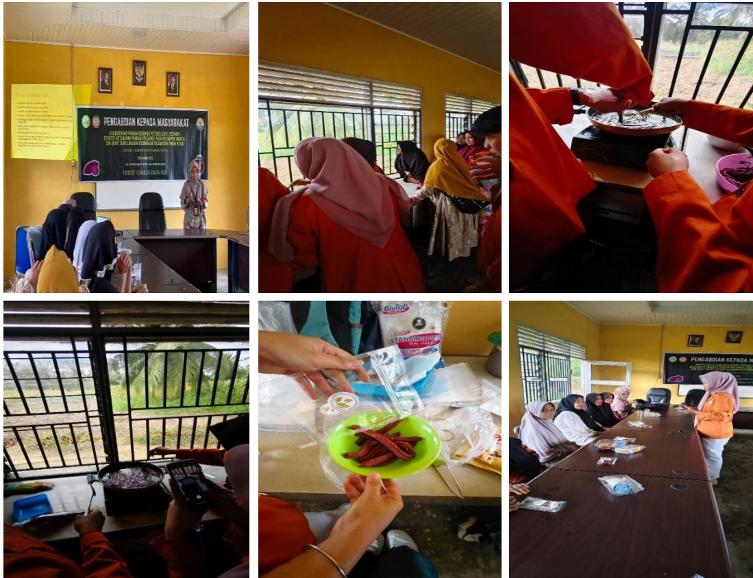
Gambar 2. Pelatihan Pembuatan Churros Ubi Ungu

Tahap pelatihan dan demonstrasi dilakukan secara langsung dengan memperagakan proses pengolahan ubi ungu menjadi churros. Peserta diberikan penjelasan mengenai bahan, alat, teknik pengolahan, pencampuran adonan, pencetakan, hingga proses penggorengan dan penyajian produk. Seluruh peserta terlibat aktif dalam praktik pembuatan churros ubi ungu sehingga suasana pelatihan berlangsung interaktif. Demonstrasi ini bertujuan agar masyarakat tidak hanya memahami teori, tetapi juga memiliki keterampilan praktis dalam mengolah pangan lokal menjadi produk yang lebih modern dan menarik. Pembahasan kegiatan pelatihan menunjukkan bahwa metode demonstrasi sangat efektif dalam meningkatkan keterampilan masyarakat. Peserta mampu mengikuti setiap tahapan pengolahan dengan baik mulai dari menghaluskan ubi ungu hingga menghasilkan churros yang siap disajikan. Kegiatan ini juga mendorong kreativitas peserta dalam mengembangkan variasi rasa dan tampilan produk. Menurut Widodo (2015), pelatihan merupakan proses sistematis untuk meningkatkan keterampilan dan kemampuan individu sehingga dapat menghasilkan kinerja yang lebih profesional. Dalam kegiatan ini, keterampilan pengolahan pangan lokal menjadi salah satu bentuk penguatan kapasitas masyarakat untuk mendukung ketahanan pangan dan peningkatan ekonomi rumah tangga.