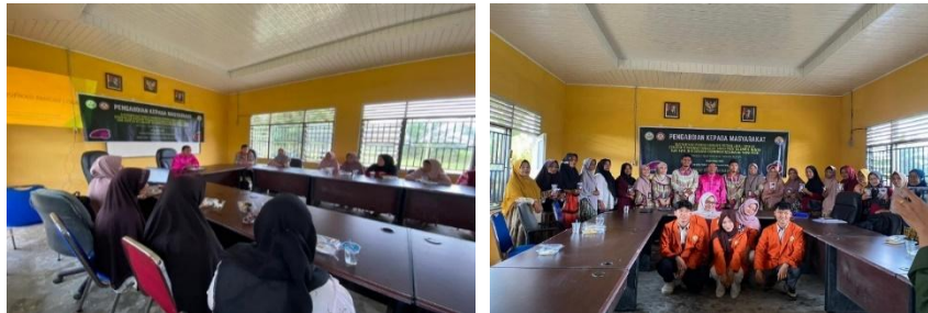
Gambar 1. Antusiasme kelompok wanita tani/masyarakat di BPP Tanah Putih

Kegiatan sosialisasi dilaksanakan di Balai Penyuluhan Pertanian (BPP) Kecamatan Tanah Putih dengan melibatkan Kelompok Wanita Tani (KWT) dan masyarakat setempat. Materi yang disampaikan meliputi pentingnya diversifikasi pangan berbasis potensi lokal, ketahanan pangan keluarga, serta pemanfaatan ubi ungu sebagai bahan pangan alternatif. Peserta terlihat antusias mengikuti kegiatan yang ditunjukkan melalui diskusi aktif, tanya jawab, serta partisipasi dalam menyampaikan pengalaman pengolahan pangan lokal yang selama ini dilakukan. Sosialisasi ini memberikan pemahaman kepada masyarakat bahwa pangan lokal tidak hanya berfungsi sebagai sumber konsumsi keluarga, tetapi juga dapat dikembangkan menjadi produk bernilai ekonomi. Pembahasan dari kegiatan sosialisasi menunjukkan adanya peningkatan pengetahuan masyarakat mengenai pentingnya ketahanan pangan keluarga melalui diversifikasi pangan. Sebelum kegiatan dilaksanakan, sebagian besar masyarakat masih bergantung pada beras sebagai makanan pokok utama. Setelah diberikan edukasi, peserta mulai memahami bahwa ubi ungu, singkong, dan pangan lokal lainnya dapat dijadikan alternatif sumber karbohidrat yang bergizi dan bernilai jual. Kegiatan ini sejalan dengan pendapat Hanani (2008) bahwa diversifikasi pangan dapat meningkatkan kualitas konsumsi pangan rumah tangga sekaligus memperkuat