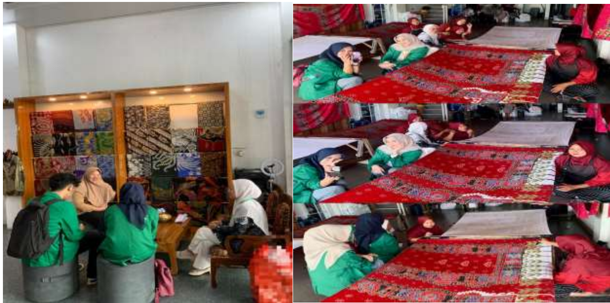
Gambar 4. Pada sesi ini, tim PKM menyampaikan materi tentang konsep dasar akuntansi manajemen, pentingnya pencatatan transaksi harian, serta pemisahan keuangan usaha dan pribadi. Peserta yang terdiri dari pemilik dan karyawan