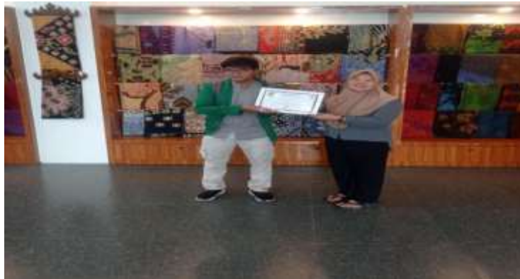
Gambar 2. Penyerahan Sertifikat oleh tim pengabdian kepada masyarakat kepada owner UMKM Batik Deandra Lampung sebagai bentuk apresiasi atas partisipasi aktif mitra dalam seluruh rangkaian kegiatan pelatihan.