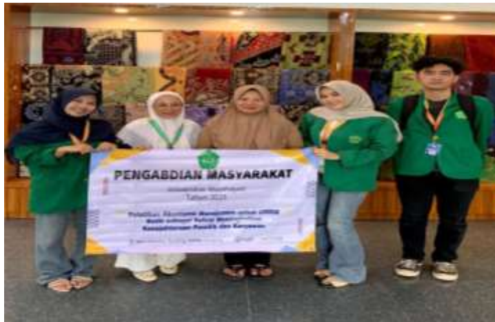
Gambar 1. Dokumentasi kegiatan pemaparan materi oleh tim PKM kepada pemilik dan karyawan UMKM Batik Deandra Lampung