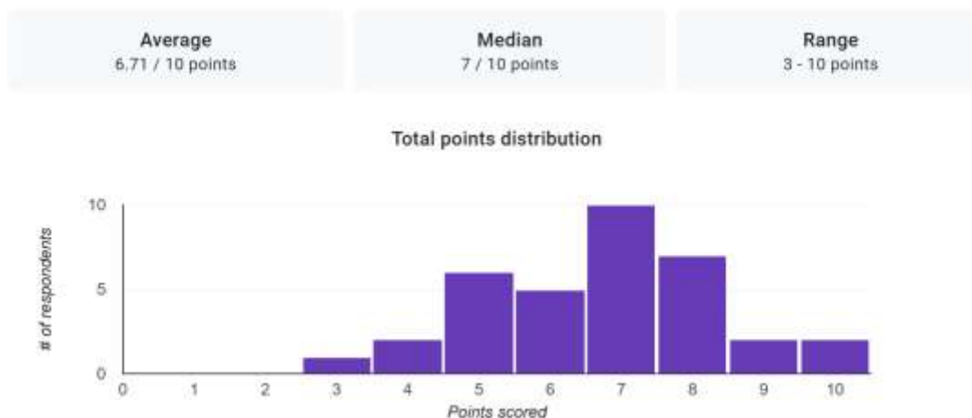
Gambar. 2 Grafik Distribusi Nilai Pre-test

Gambar 2 menunjukkan hasil pre-test dengan nilai rata-rata 6,71 dalam skala 0-10. Nilai tengah yaitu 7, sedangkan nilai terendah adalah 3 dan nilai tertinggi adalah 10. Pre-test dilakukan secara online melalui Google Form dengan terlebih dahulu melakukan scan pada QR Code yang diberikan untuk mengakses link Google Form tersebut.