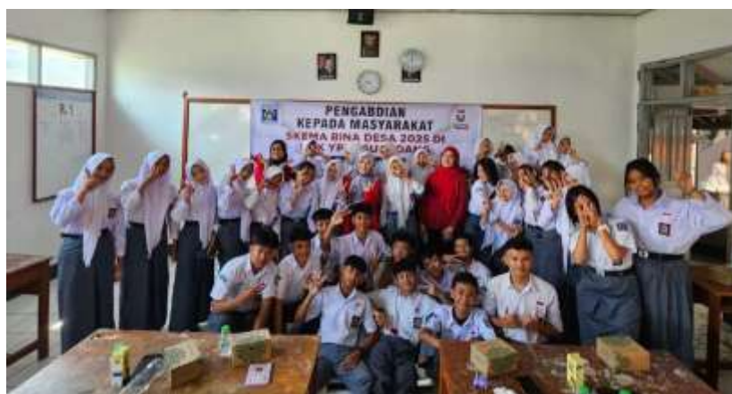
Gambar. 6 Foto bersama dengan siswa setelah penyampaian materi

Gambar 5 menunjukkan sesi tanya jawab terkait materi “Investasi untuk Generasi Z” dan “Bisnis Modal Kecil: Jalan Menuju Mandiri Finansial untuk Gen Z.” Pada sesi tanya jawab ini, para siswa antusias menanyakan mengenai kiat-kiat yang harus dilakukan ketika memulai investasi dan bisnis. Selain itu diberikan juga pertanyaan dalam bentuk games dengan hadiah-hadiah yang menarik bagi para siswa sehingga para siswa tertarik untuk aktif terlibat dalam pelatihan tersebut. Pada sesi ini terlihat interaksi dua arah di antara para siswa sebagai peserta pelatihan dan para dosen sebagai pemberi materi pelatihan.