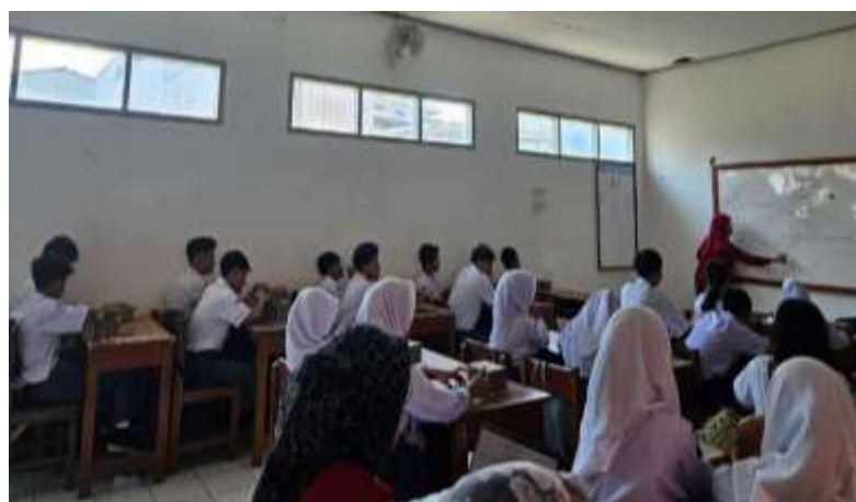
Gambar. 4 Penyampaian materi

Berikut ini adalah gambar-gambar dokumentasi pelaksanaan kegiatan tersebut: