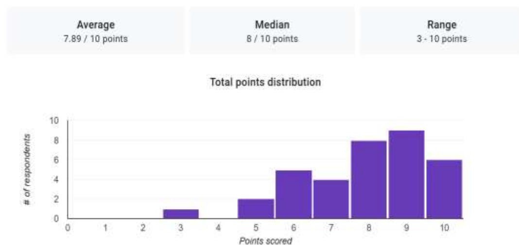
Gambar. 3 Grafik Distribusi Nilai Post-test

Gambar 2 menunjukkan hasil pre-test dengan nilai rata-rata 6,71 dalam skala 0-10. Nilai tengah yaitu 7, sedangkan nilai terendah adalah 3 dan nilai tertinggi adalah 10. Pre-test dilakukan secara online melalui Google Form dengan terlebih dahulu melakukan scan pada QR Code yang diberikan untuk mengakses link Google Form tersebut.