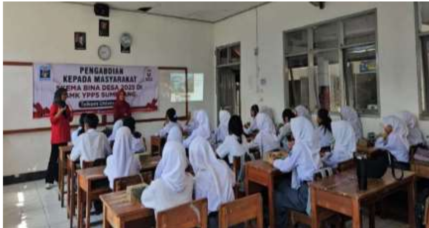
Gambar. 5 Proses tanya jawab materi

Gambar 4 menunjukkan proses penyampaian materi terkait “Investasi untuk Generasi Z” dan “Bisnis Modal Kecil: Jalan Menuju Mandiri Finansial untuk Gen Z.” Pada penyampaian materi ini diberikan contoh-contoh riil terkait investasi yang memungkinkan bagi Gen Z dan peluang bisnis yang dapat dijalankan oleh para siswa dengan perhitungan perkiraan biaya, modal, dan keuntungan yang mungkin dihasilkan.