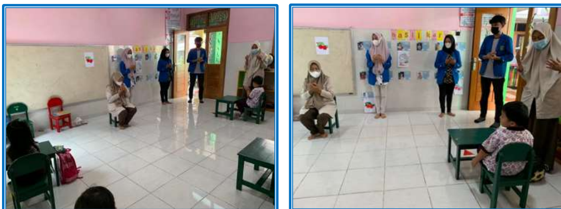
Gambar 2. Doa Bersama

Meningkatkan rasa syukur, iman dan taqwa kepada Tuhan Yang Maha Esa, dalam konteks ini kegiatan di dalam kelas yang diawali dengan doa bersama sebelum pembelajaran di kelas dimulai tunduk dalam meningkatkan rasa syukur, iman dan taqwa kepada Tuhan Yang Maha Esa sebagaimana tergambar pada Gambar 2. Kesesuaian dan keselarasan ikatan manusia dengan (manusia, lingkungan, dan Tuhan) merupakan akar dari pembangunan berkelanjutan (Faizah & Nugraheni, 2024). Artinya, di dalam proses pembelajaran selain pencapaian ranah kognitif, afektif, dan psikomotorik PAUD Cendekia Kids School Kota Madiun telah melakukan salah satu upaya membentuk karakter berakhlak mulia dengan melakukan doa bersama ikatan kepada Tuhan Yang Maha Esa sebelum pembelajaran berlangsung sesuai (Undang – Undang Republik Indonesia Nomor 20 Tahun 2003 Tentang Sistem Pendidikan Nasional, 2003) untuk mengembangkan potensi peserta didik menjadi manusia yang beriman dan bertakwa kepada Tuhan Yang Maha Esa, berakhlak mulia, sehat, berilmu, cakap, kreatif, mandiri, dan menjadi warga negara yang demokratis serta bertanggung jawab.