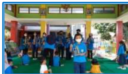
Gambar 6. Memainkan alat musik tradisional angklung

Program yang menggabungkan elemen budaya ke dalam permainan dapat mendorong anak-anak untuk mengeksplorasi dan mengekspresikan identitas anak-anak. Penyediaan alat musik tradisional yang tepat dapat merangsang kreativitas dan memungkinkan anak-anak untuk berinovasi dalam konteks budaya, sementara partisipasi dalam kegiatan kesenian menumbuhkan pengalaman imajinatif yang mengarah pada persepsi progresif. Selain itu, paparan awal terhadap alat-alat budaya membantu dalam pelestarian tradisi lokal yang memastikan untuk tidak dilupakan. Artinya, pengenalan alat musik tradisional sejak dini mampu meningkatkan pelestarian kesenian daerah dengan tumbuhnya kesadaran dan kreatifitas siswa PAUD Cendekia Kids School Kota Madiun yang ditunjukkan dengan antusiasnya siswa dalam memainkan alat musik tradisional krek dongkrek. Sebagaimana yang diungkapkan oleh Rosa et al., (2021) bahwa pembelajaran kolaboratif dan bermain peran di kelas drama dapat menumbuhkan minat dan respons siswa untuk mempelajari budaya lokal. Artinya, pendidikan berperan penting dalam menumbuhkan kesadaran budaya, di mana budaya sebagai identitas nasional suatu bangsa.