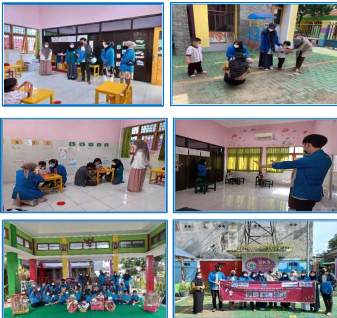
Gambar 4. Keberagaman Bahasa, Asal Daerah, Agama

Membangun jiwa kebinekaan, toleransi, dan nasionalisme dengan keberagaman bahasa, asal daerah, agama tetap bersatu dan saling menghormati yang ditunjukkan pada Gambar. 4. Tercermin dalam Bhinneka Tunggal Ika yang diakui secara mendalam mengenai urgensinya fenomena budaya yang beragam (Sucitra & Lasiyo, 2023). Artinya, adanya keberagaman bahasa, asal daerah, agama, suku, dan budaya namun tetap satu dalam kesatuan.