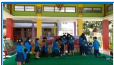
Gambar 5. Memainkan alat musik tradisional krek dongkrek