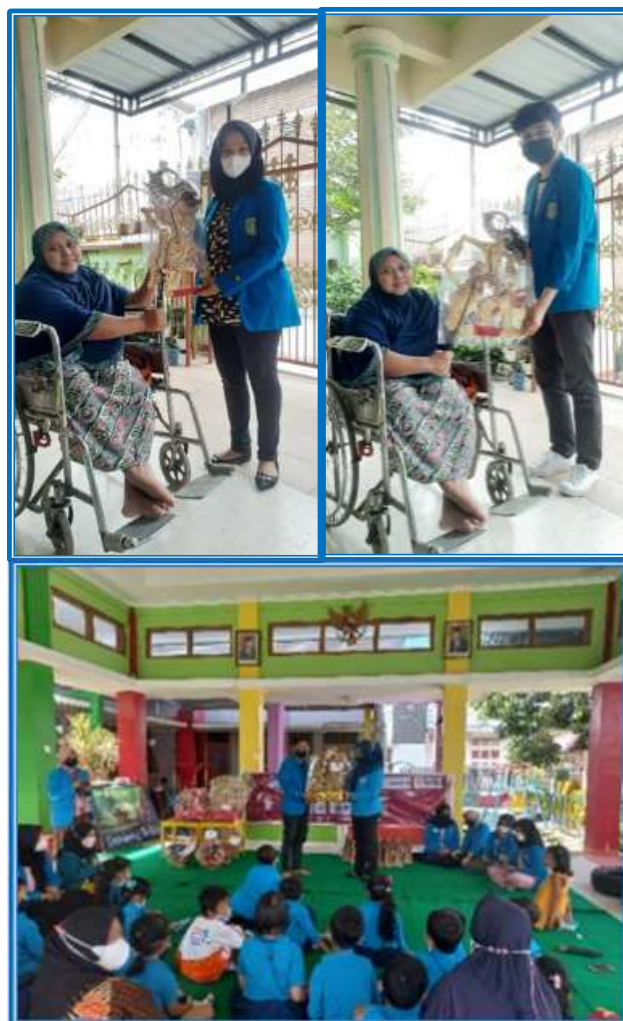
Gambar 3. Pembelian dan Penyerahan Media Ajar Kesenian Daerah

Di mana pada dimensi altruistik meliputi tindakan pro-sosial sebagai contoh menolong orang lain tanpa mengharapkan timbal balik yang termasuk dalam perilaku berkelanjutan tentunya sebelum bertindak untuk orang lain dan lingkungan harus berperilaku peduli dengan dirinya sendiri (Corral-Verdugo et al., 2021). Artinya, rasionalnya manusia berperilaku peduli diri terlebih dahulu yang dilanjutkan perilaku berkelanjutan untuk menyeimbangkan tanpa harus merepotkan orang lain dan tentunya akan berbeda yang memiliki empaty lebih dominan sehingga melekatlah altruisme dalam diri seseorang. Oleh sebab itu juga diperlukan kecenderungan egoistik dalam diri seseorang untuk menumbuhkan perilaku peduli terhadap diri sendiri.