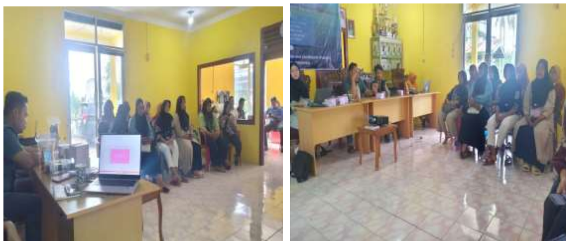
Gambar 2. Foto kegiatan

Mengacu pada hasil evaluasi kegiatan pelatihan ada peningkatan peserta dalam penggunaan canva dan media digital.