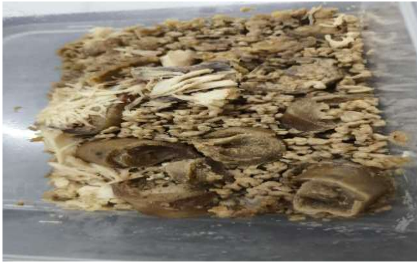
Gambar 7. Pengolahan sampah berbasis maggot Black Soldier Fly (BSF)

Pengolahan sampah berbasis maggot BSF terdiri dari beberapa langkah, Dimana diawali dengan mengumpulkan lalat BSF. Sebagai induk yang menghasilkan telur. Ada tiga keuntungan dalam budidaya maggot BSF yaitu maggot BSF bisa mengurai sampah organik dalam waktu 24 jam, kedua maggot untuk pengganti pakan baik unggas, ikan, dan lain sebagainya. Ketiga, maggot menghasilkan kasgot (bekas maggot BSF) yang bisa dimanfaatkan untuk pupuk. Pakan sampah organik ini bisa dihabiskan maggot BSF dalam waktu 24 jam. Tumpukan sampah dari aktivitas sehari-hari dapat diolah bersama dengan menggunakan maggot BSF. Pengolahan sampah berbasis maggot juga menghasilkan kasgot/sisa pencernaan larva maggot BSF. Kasgot dapat digunakan sebagai pupuk organik untuk tanaman. Kasgot memiliki berbagai manfaat, seperti untuk kesuburan, meningkatkan pertumbuhan tanaman dan efisien karena bisa diolah secara mandiri (Mulyaningsih & Wijaya, 2025). Pada pemeliharaan dengan menyediakan kondisi lingkungan yang sesuai untuk maggot BSF. Beberapa tahapan dalam pengolahan sampah berbasis maggot BSF secara sederhana meliputi :