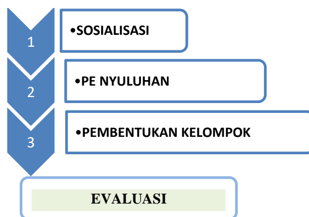
Gambar 1. Pelaksanaan kegiatan

Kegiatan penyuluhan disampaikan materi mengenai pengenalan maggot BSF dan budidaya maggot untuk pengolahan sampah organik berbasis maggot kepada peserta kegiatan. Kegiatan Evaluasi dilaksanakan sebelum penyuluhan dan setelah penyuluhan. Sebelum penyuluhan dilakukan penilaian kepada peserta untuk mengetahui seberapa besar pengetahuan peserta pada pengolahan sampah berbasis maggot. Selanjutnya, setelah penyuluhan dilakukan penilaian kepada peserta terhadap capaian pemahaman pada materi yang telah disampaikan. Penilaian sebelum penyuluhan dan setelah penyuluhan dilakukan dengan pengisian kuisioner. Pembentukan kelompok pengolah sampah dapur berbasis maggot BSF dilakukan dengan dasar kepada anggota yang berpotensi menghasilkan sampah jenis organik yang dapat digunakan untuk kehidupan maggot dan para anggota yang mempunyai potensi dalam pengolahan sampah organik berbasis maggot BSF.