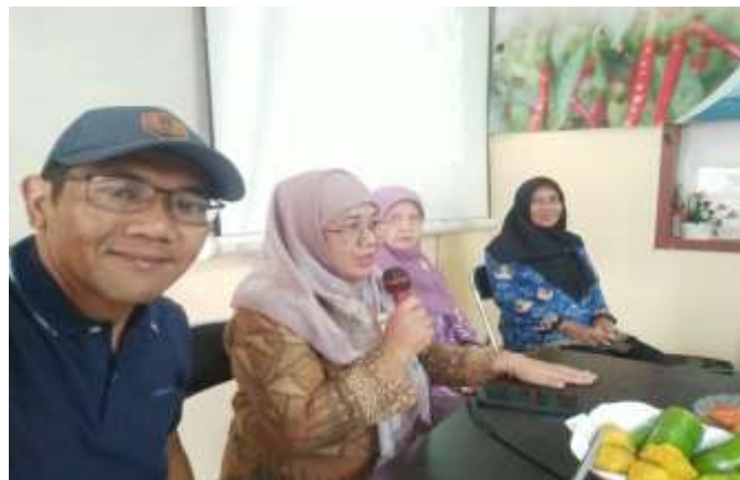
Gambar 2. Kegiatan sosialisasi

Pada kegiatan sosialisasi juga dilaksanakan dialog untuk menggali persamaan persepsi terhadap kegiatan yang akan dilaksanakan, Pada saat dialog antara tim pelaksana kegiatan dan para peserta petani muda menghasilkan kesepakatan mengenai pemahaman dalam pengelolaan sampah perlu adanya daya dukung dari masyarakat dalam pengelolaan sampah secara mandiri. Hal tersebut sangat diperlukan karena potensi sampah yang dihasilkan dari aktivitas sehari-hari semakin meningkat dan keterbatasan pengelolaan sampah oleh pemerintah, khususnya di wilayah desa Supiturang kecamatan Karangpoloso, kabupaten Malang.