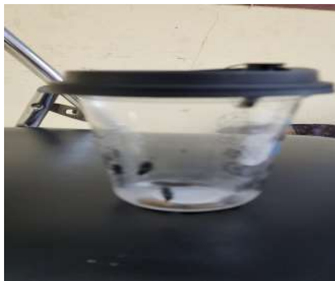
Gambar 4. Lalat Black Soldier Fly (BSF)