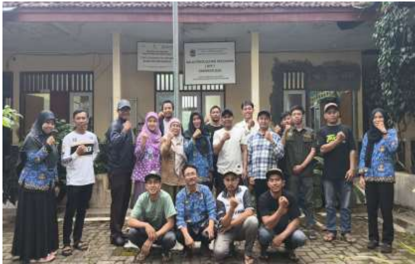
Gambar 8. Peserta Kegiatan

Pada akhir penyuluhan dilakukan post test kepada peserta untuk mengetahui sejauh mana pemahaman dalam pengolahan sampah berbasis maggot BSF. Hasil capaian kuisioner menunjukkan bahwa pemahaman peserta terhadap materi pengolahan sampah berbasis maggot sebesar 100 %. Semua peserta memahami teknik pengolahan sampah berbasis maggot BSF. Hasil ini merupakan capaian hasil sangat baik pada kegiatan penyuluhan yang telah dilaksanakan.