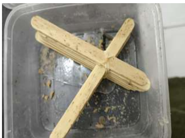
Gambar 5. Maggot Black Soldier Fly (BSF)

Maggot BSF merupakan bagian dari siklus hidup lalat Black Soldier Fly (BSF). Lalat BSF yang telah dewasa akan melakukan perkawinan. Lalat Jantan BSF akan mengalami kematian setelah perkawinan. Setelah perkawinan pada kurun waktu 2- 3 hari, lalat betina BSF akan bertelur. Setelah bertelur lalat betina akan mati. Selanjutnya masa inkubasi telur memerlukan waktu yang pendek yaitu sekitar 3-4 hari dan menghasilkan larva, larva ini yang dikenal dengan maggot BSF. Pada hari ke 1 ukuran larva sangat kecil, kurang dari 1 mm. Pada stadia larva/maggot BSF berlangsung selama 18 hari, sebagai larva dewasa berwarna putih. Selanjutnya setelah stadia larva selesai masuk ke stadia pupa, terjadi perubahan bentuk menjadi pupa dengan warna menjadi hitam. Stadi pupa berlangsung selama 14 hari, Setelah stadia pupa berakhir maka pupa menjadi lalat dewasa. Lalat BSF tidak menumbuhkan aroma yang tidak sedap dan tidak pembawa sumber penyakit (Kodrianingsih et al. , 2022) Siklus hidup lalat BSF disajikan pada Gambar 6.