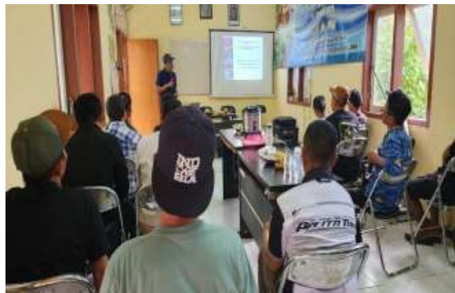
Gambar 3. Penyampaian materi penyuluhan

Pada materi pengenalan maggot disampaikan siklus hidup maggot dari lalat Black Soldier Fly (BSF). Maggot atau juga disebut sebagai belatung lalat Black Soldier Fly (BSF). Maggot merupakan bentuk larva dari jeins lalat Black Soldier Fly (BSF) merupakan tahap larva. Lalat dalam siklus hidupnya secara perlahan mulai mengalami metamorfosis sempurna. Maggot BSF memiliki ciri morfologi yang khas. Maggot BSF memiliki bentuk tubuh yang lebih ramping dan memanjang, tidak memiliki segmen tubuh. Tubuh maggot BSF cenderung terlihat lebih halus dan seragam. Selain itu pada warnanya, maggot umumnya berwarna putih kekuningan atau krem , terkadang sedikit kecoklatan. Warnanya bisa sedikit bervariasi tergantung instar (stadium pertumbuhan) maggot. Pada bagian atasnya, maggot tidak memiliki kepala yang jelas dan terpisah dari tubuhnya. Bagian depan tubuhnya tumpul dan tidak memiliki struktur seperti antena atau mata. Maggot BSF tidak memiliki kaki , bergerak dengan cara merayap menggunakan otot-otot di tubuhnya. Gambar maggot disajikan pada Gambar 5.