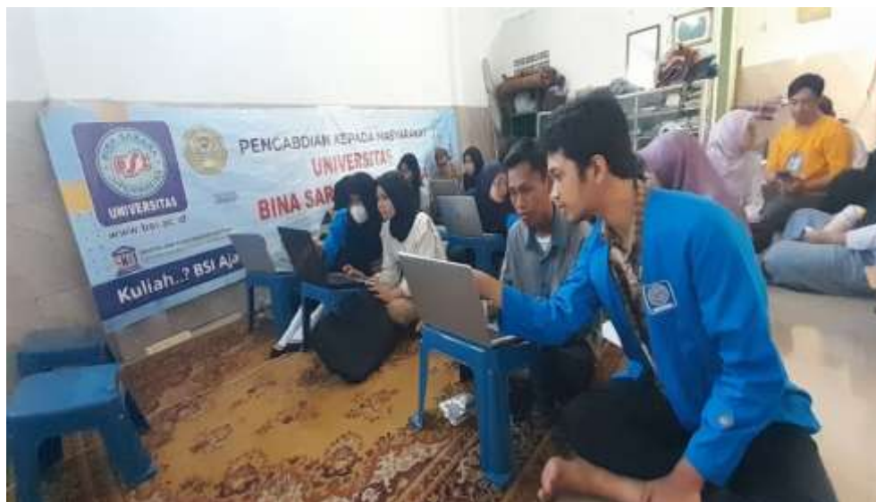
Gambar 2. Peserta antusias mengikuti materi yang disampaikan narasumber

Keberhasilan PkM ini tidak hanya dilihat dari peningkatan skill individu, melainkan juga dari dampak jangka menengah terhadap kelembagaan RT. Pemilihan metode hands-on training dan penggunaan modul yang praktis terbukti relevan dan efektif bagi peserta non-akademik, memastikan transfer pengetahuan berjalan optimal. Dengan terwujudnya sistem data digital yang terstandarisasi, RT. 10 kini memiliki basis data yang mutakhir sebagai pondasi kuat untuk pengambilan keputusan dan perencanaan program komunitas di masa depan (misalnya, program bantuan sosial, vaksinasi, atau penanggulangan bencana). Program ini juga memiliki signifikansi sosial, yaitu pemberdayaan perempuan (Kader Dasawisma) sebagai agen perubahan digital di lingkungan terkecil masyarakat. Dengan demikian, PkM ini telah berhasil mewujudkan visi untuk menjadikan administrasi RT. 10 lebih adaptif terhadap kemajuan teknologi, sekaligus memberikan kontribusi nyata dalam upaya mempersempit kesenjangan digital di tingkat akar rumput, yang merupakan kunci keberlanjutan dan kemandirian komunitas dalam jangka panjang.