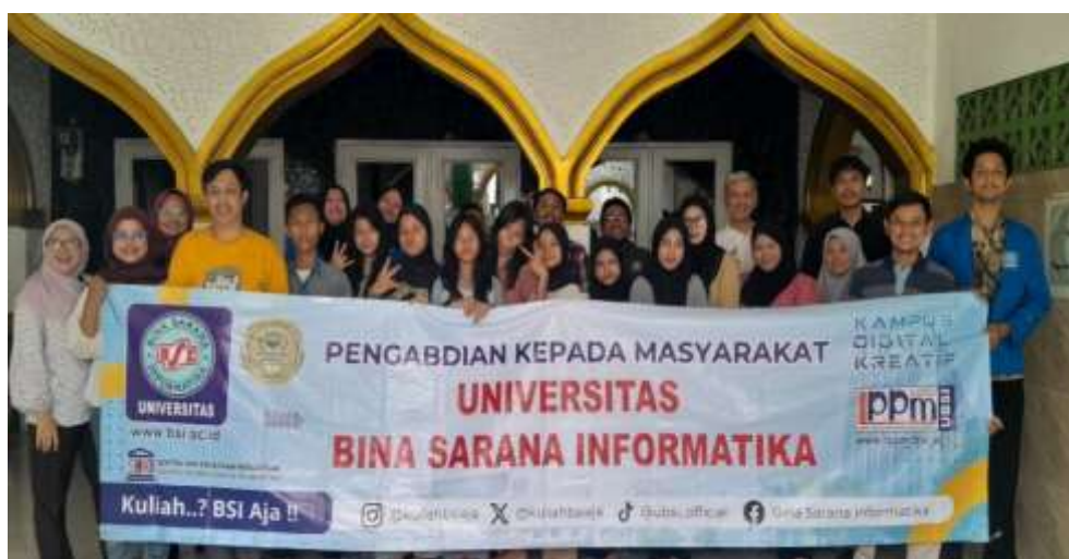
Gambar 3. Foto bersama dengan peserta kader Dasawisma

Keberhasilan PkM ini tidak hanya dilihat dari peningkatan skill individu, melainkan juga dari dampak jangka menengah terhadap kelembagaan RT. Pemilihan metode hands-on training dan penggunaan modul yang praktis terbukti relevan dan efektif bagi peserta non-akademik, memastikan transfer pengetahuan berjalan optimal. Dengan terwujudnya sistem data digital yang terstandarisasi, RT. 10 kini memiliki basis data yang mutakhir sebagai pondasi kuat untuk pengambilan keputusan dan perencanaan program komunitas di masa depan (misalnya, program bantuan sosial, vaksinasi, atau penanggulangan bencana). Program ini juga memiliki signifikansi sosial, yaitu pemberdayaan perempuan (Kader Dasawisma) sebagai agen perubahan digital di lingkungan terkecil masyarakat. Dengan demikian, PkM ini telah berhasil mewujudkan visi untuk menjadikan administrasi RT. 10 lebih adaptif terhadap kemajuan teknologi, sekaligus memberikan kontribusi nyata dalam upaya mempersempit kesenjangan digital di tingkat akar rumput, yang merupakan kunci keberlanjutan dan kemandirian komunitas dalam jangka panjang.