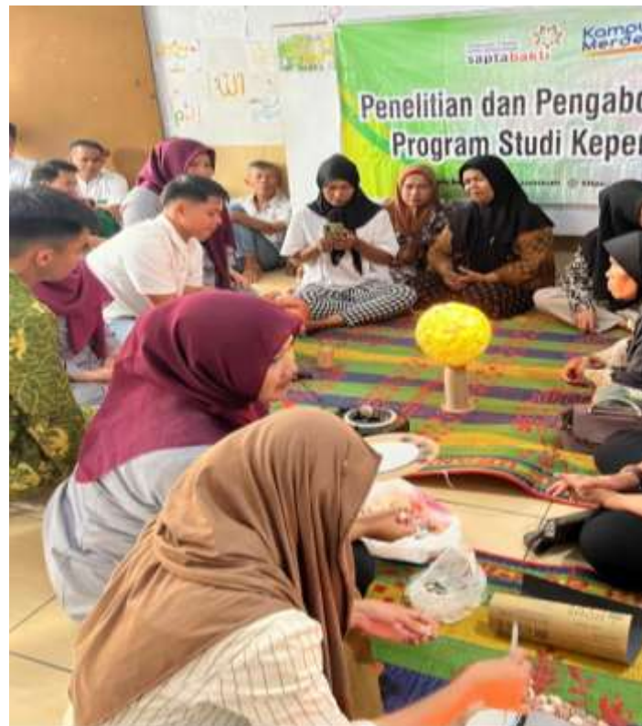
Gambar 2. Suasana Pelatihan Hands-on Training dengan Peserta yang Aktif Terlibat dalam Pembuatan Produk Kerajinan

Gambar ini menampilkan momen kegiatan pelatihan praktik (hands-on training) di mana para peserta secara langsung terlibat dalam proses pembuatan produk kerajinan dari kulit kerang dan sisik ikan. Peserta tampak fokus pada setiap tahap pengerjaan, mulai dari pemotongan bahan, penyusunan pola, hingga pemasangan aksesoris tambahan dan pewarnaan. Aktivitas ini menunjukkan pendekatan pembelajaran yang interaktif dan praktis, memungkinkan peserta untuk mempelajari teknik secara langsung dengan bimbingan fasilitator. Suasana pelatihan terlihat dinamis, dengan peserta duduk di meja kerja masing-masing atau berkelompok kecil, saling berdiskusi dan bertukar ide terkait desain produk. Tumpukan bahan baku dan peralatan kerajinan seperti gunting, lem, kuas, dan cat akrilik terlihat di sekitar peserta, menggambarkan kesiapan sarana untuk praktik. Hal ini menekankan keterlibatan aktif peserta, menunjukkan bahwa pelatihan ini tidak hanya bersifat teoretis tetapi menekankan praktik langsung, yang dapat meningkatkan keterampilan teknis dan kreativitas peserta. Kehadiran fasilitator di dekat peserta memastikan bimbingan yang tepat, sehingga setiap produk yang dihasilkan memiliki kualitas yang baik.