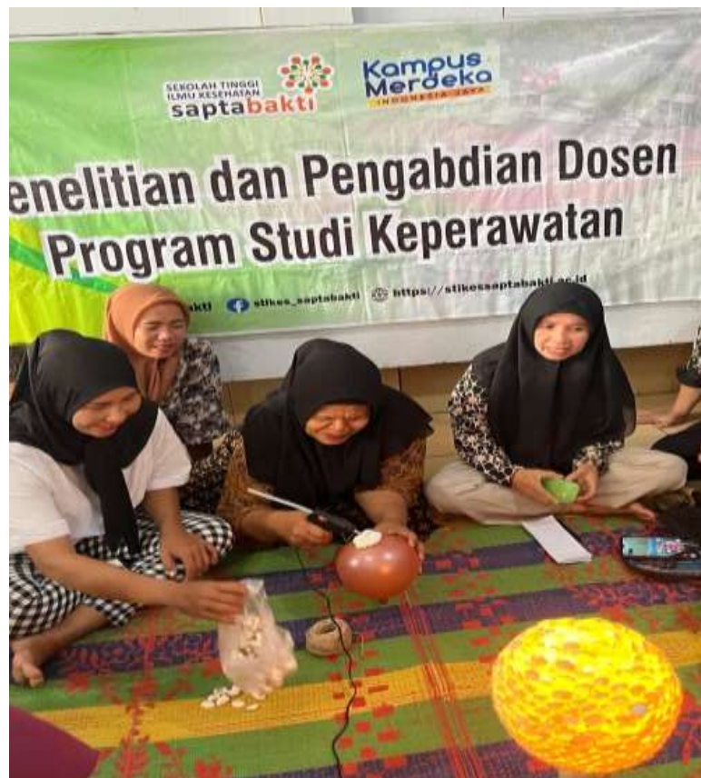
Gambar 3. Pelatihan Praktik (Hands on Training)

Gambar ini menampilkan kegiatan pelatihan praktik (hands-on training) yang fokus pada pembuatan kerajinan dari kulit kerang dan sisik ikan. Peserta terlihat sedang melakukan tahap-tahap proses pembuatan kerajinan, mulai dari pemilahan bahan baku, pemotongan, pembentukan pola, hingga pewarnaan dan pelapisan pernis. Setiap peserta dibimbing oleh fasilitator yang memastikan teknik pengerjaan dilakukan dengan tepat sehingga hasil kerajinan memiliki kualitas yang baik. Suasana pelatihan terlihat aktif dan interaktif, dengan peserta duduk berkelompok, saling berdiskusi, dan bertukar pengalaman mengenai desain serta teknik pengerjaan. Peralatan kerajinan seperti lem, gunting, kuas, cat akrilik, dan pernis tersusun rapi di meja kerja, memperlihatkan kesiapan sarana mendukung proses belajar secara efektif. Gambar ini menekankan metode pelatihan berbasis praktik langsung yang memungkinkan peserta menguasai keterampilan secara konkret. Kegiatan hands-on training ini tidak hanya meningkatkan kemampuan teknis peserta, tetapi juga menumbuhkan kreativitas dan kemandirian dalam menghasilkan produk bernilai jual tinggi.