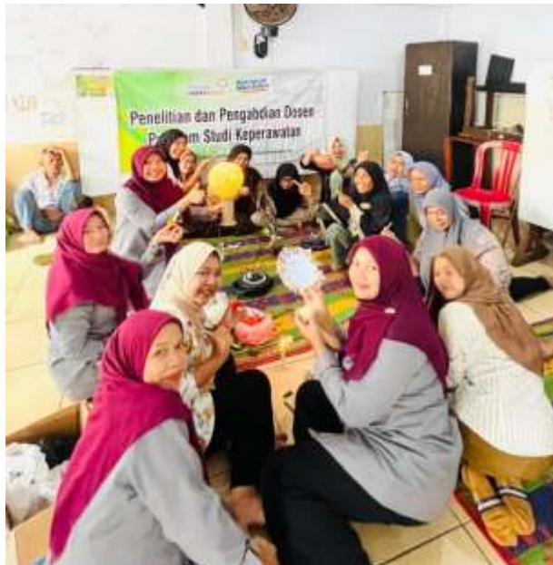
Gambar 1. Peserta Pelatihan Praktik Kerajinan Kulit Kerang dan Sisik Ikan Sedang Memperlihatkan Produk Hasil Kerajinan

sisik yang cocok untuk dijadikan bahan kerajinan. Selain itu, beberapa peserta juga mengalami kesulitan dalam memperoleh alat-alat produksi yang memadai, yang menghambat proses pembuatan produk. Untuk itu, diperlukan dukungan lebih lanjut dalam menyediakan bahan baku dan fasilitas produksi yang lebih baik.