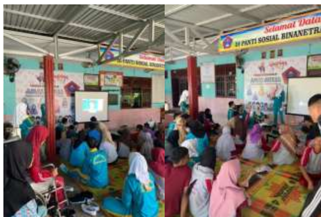
Gambar 1. Pemutaran video edukasi dan simulasi cara interaksi sosial

Seluruh kegiatan dilaksanakan secara interaktif dan inklusif, dengan pendekatan visual-auditori yang disesuaikan dengan kemampuan siswa.