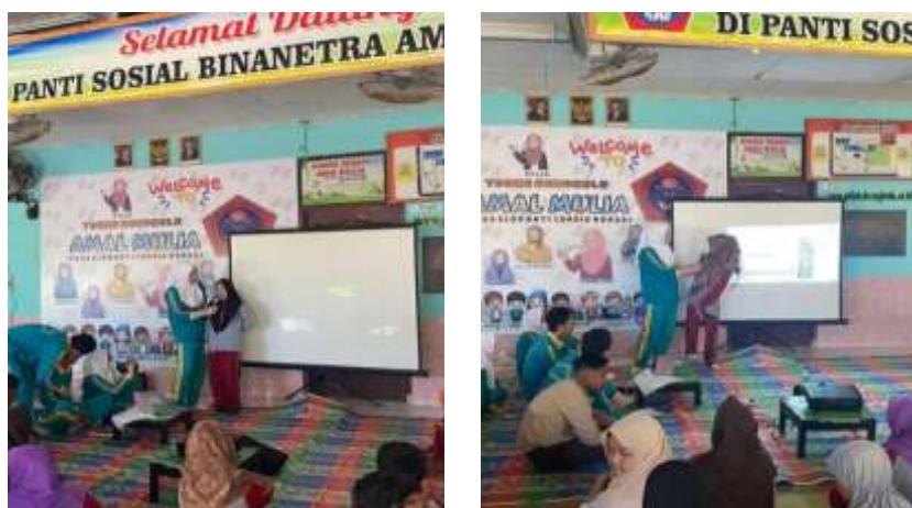
Gambar 2. Evaluasi Pelaksanaan Kegiatan

Gambar 2. menunjukkan proses evaluasi kegiatan pengabdian kepada masyarakat pada sesi akhir program penguatan interaksi sosial remaja berkebutuhan khusus. Pada gambar pertama, tampak seorang peserta didampingi fasilitator untuk menampilkan kembali perilaku sosial yang telah dipelajari selama mengikuti tayangan video edukasi. Peserta terlihat praktik langsung cara menyapa atau berinteraksi dengan sopan, sementara teman-teman yang lain mengamati. Proses ini merupakan bagian dari evaluasi formatif yang dilakukan melalui observasi langsung terhadap kemampuan siswa dalam mempraktikkan keterampilan sosial secara mandiri. Pendampingan fasilitator berfungsi untuk memberikan arahan ringan tanpa menghilangkan kesempatan peserta untuk menunjukkan kemampuan yang sudah berkembang.