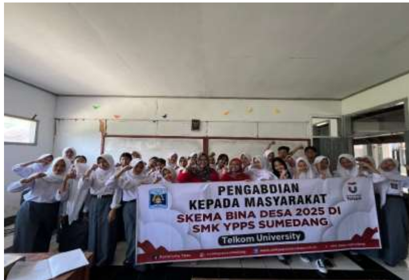
Gambar 2. Kegiatan Pengabdian Kepada Masyarakat

wallet, mobile banking, serta perencanaan anggaran. Setelah itu, materi pelatihan disampaikan dengan fokus pada pemahaman dasar mengenai literasi keuangan digital, cara menggunakan aplikasi e-wallet, mobile banking, serta teknik-teknik dalam menyusun anggaran pribadi yang lebih terstruktur. Setelah penyampaian materi, peserta diajak untuk melakukan simulasi penggunaan aplikasi keuangan digital secara langsung, sehingga mereka dapat merasakan pengalaman praktis dalam pengelolaan keuangan. Program ini ditutup dengan post-test untuk mengukur peningkatan pemahaman peserta mengenai materi yang telah disampaikan.