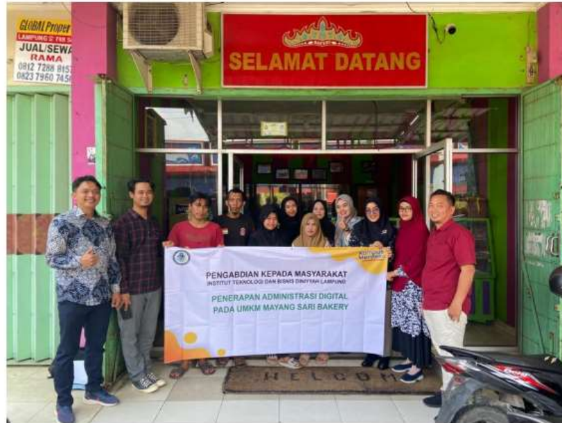
Gambar 2. Dokumentasi kegiatan

terjadinya pergeseran perilaku menuju sistem yang lebih disiplin dan transparan. Hasil tersebut sesuai dengan penelitian (Fitari et al., 2025) yang menyatakan bahwa adopsi media digital dalam kegiatan operasional UMKM mendorong keteraturan dan transparansi administrasi yang berdampak pada peningkatan kepercayaan pelanggan.