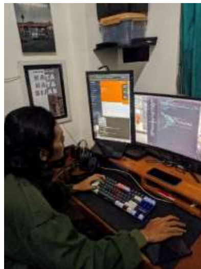
Gambar 3. Proses Pembuatan Sistem

Hasil Absensi Online tersebut disimpan menggunakan Firebase sebagai database, mulai dari penyimpanan user, data identitas user, data pengajuan izin dan lembur, dan data absensi. Tampilan dari desain firebase sistem Absensi Online dapat dilihat pada gambar 4.