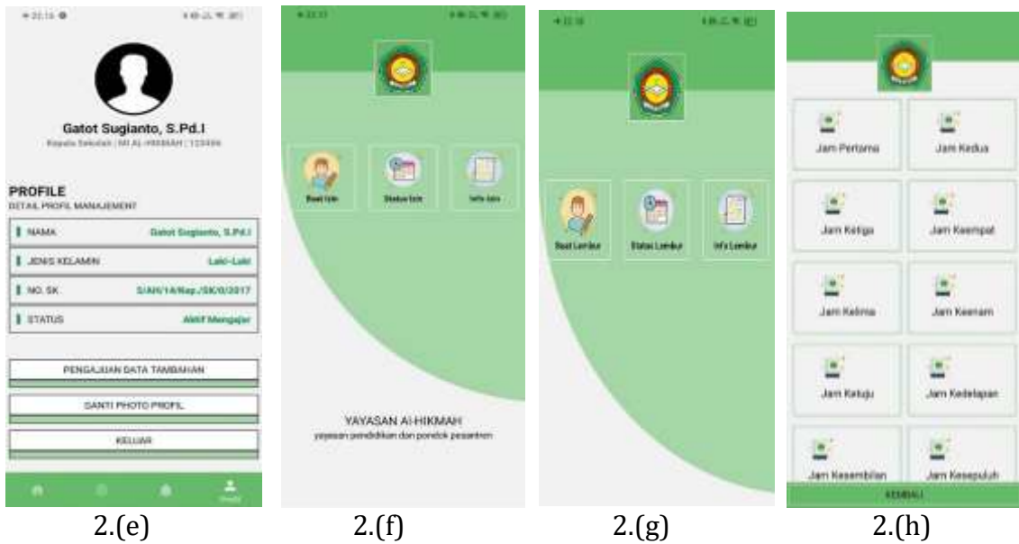
Gambar 2.(a). Tampilan Login ; 2.(b) Tampilan Password; 2.(c) Tampilan Home; 2.(d) Tampilan Absen; 2.(e) Halaman Profil; 2.(f) Tampilan Menu Izin; 2.(g) Tampilan Menu Lembur; 2.(h) Tampilan Menu Jurnal