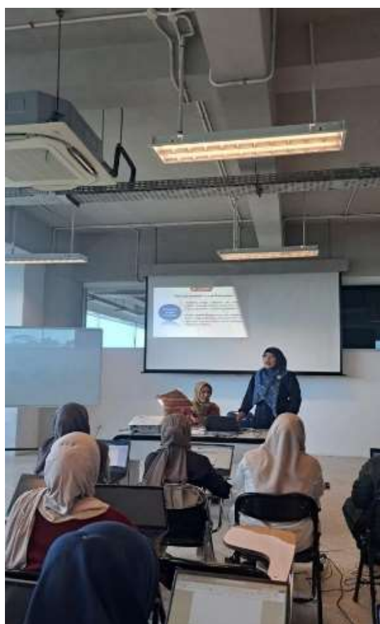
Gambar 1. Proses penyampaian materi

akses internet dan keraguan mahasiswa dalam menuliskan deskripsi diri. Kondisi ini menandakan perlunya pendampingan lebih lanjut agar mahasiswa mampu mengoptimalkan akun LinkedIn sesuai standar profesional. Pemanfaatan LinkedIn secara aktif terbukti membantu mahasiswa dalam meningkatkan kesiapan menghadapi dunia kerja (Pena et al., 2022; Healy et al., 2023). Selain itu, profil LinkedIn kini mulai dipertimbangkan dalam proses rekrutmen, baik melalui asesmen profil maupun penilaian personal branding (Sallach et al., 2024; Mönke et al., 2025). Hasil ini sejalan dengan temuan Lexis et al. (2023) bahwa mahasiswa tetap menggunakan LinkedIn dalam jangka panjang setelah mendapat pendampingan awal, sehingga penting untuk menyediakan program lanjutan yang lebih intensif.