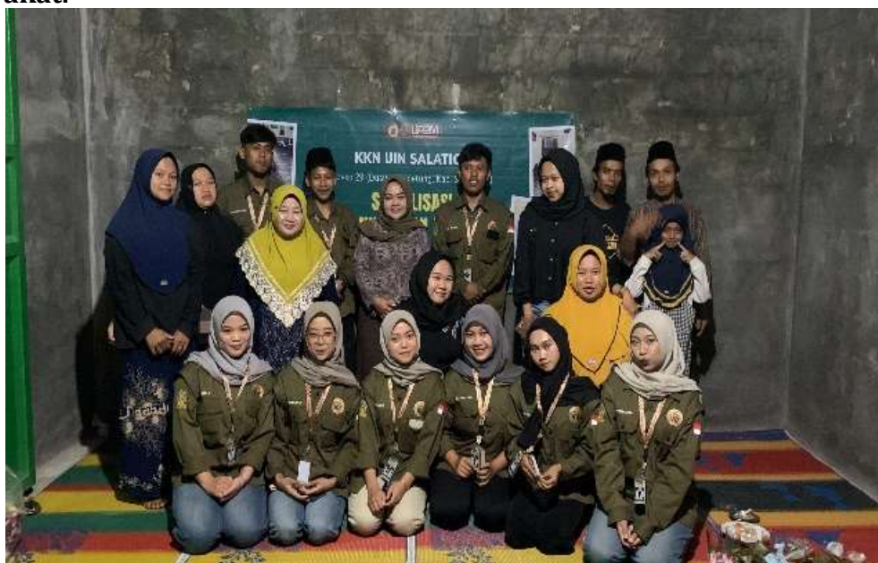
Gambar 2. Partisipasi Masyarakat Dusun Gerpetung pada Sosialisasi Hukum

Penyuluhan hukum yang dilakukan oleh dinas terkait seperti Dinas Pemberdayaan Perempuan, Perlindungan Anak, dan Keluarga Berencana (DP3AP2KB) sangat berperan dalam menekan angka pernikahan dini dan mempengaruhi perilaku serta partisipasi masyarakat di Sidomukti. Program penyuluhan dan sosialisasi pencegahan pernikahan dini yang meliputi edukasi pra-nikah, bimbingan pernikahan, dan kursus pra-nikah telah memberikan dampak positif. Partisipasi masyarakat meningkat melalui forum-forum edukasi dan kolaborasi lintas sektor, sehingga kesadaran masyarakat terhadap bahaya pernikahan dini dan perceraian menjadi lebih baik. Hal ini mencerminkan efektivitas penyuluhan hukum dalam merubah perilaku dan