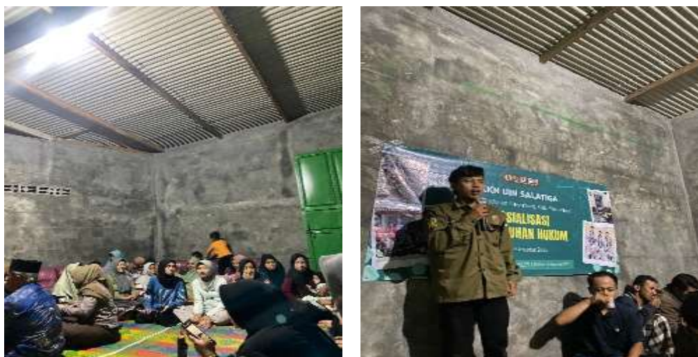
Gambar 1. Sosialisasi Penyuluhan Hukum di Dusun Gerpetung