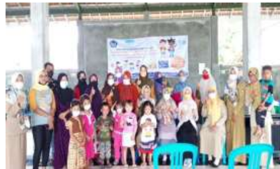
Gambar 6. Kebersamaan Peserta