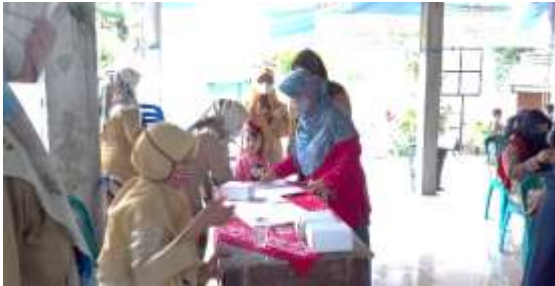
Gambar 3. Registrasi Peserta

dilaksanakan indoor sehingga lebih kondusif dan fokus. Hasil evaluasi menunjukkan bahwa sebesar 47,1% kegiatan sangat bermanfaat, 35,3% bermanfaat, dan 17,6% cukup bermanfaat, sehingga kegiatan pengabdian berhasil dalam memberikan penyuluhan penjelasan, sharing session pengetahuan dan pengalaman terkait pentingnya komunikasi baik orang tua siswa PAUD, TK, dan SD dengan anak di Desa Sambirejo dalam upaya menghasilkan generasi cerdas yang berakhlak mulia. Berikut gambar pelaksanaan aktivitas pengabdian masyarakat di Desa Sambirejo oleh tim.