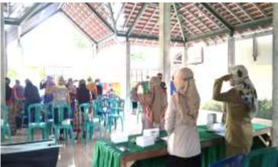
Gambar 5. Penjelasan Materi