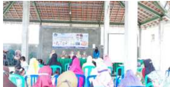
Gambar 4. Pembukaan Kegiatan