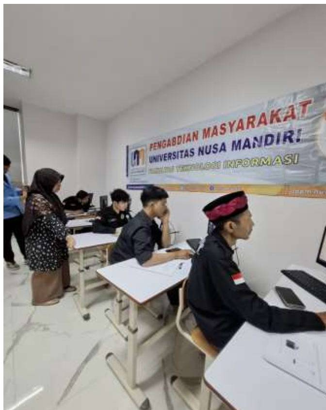
Gambar 4. Suasana pelatihan Trello bagi anggota IKRAR 007 di Kampus Universitas Nusa Mandiri Margonda

Secara keseluruhan, pelatihan ini telah menghasilkan peningkatan kapasitas digital, kesadaran akan pentingnya manajemen proyek, serta penguatan fungsi organisasi pemuda berbasis teknologi. Harapannya, pelatihan ini tidak hanya menghasilkan perubahan jangka pendek dalam pengetahuan peserta, tetapi juga memberikan dampak berkelanjutan dalam tata kelola kegiatan di lingkungan komunitas mereka.