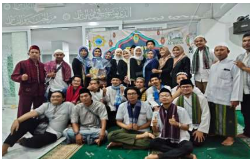
Gambar 1. Dokumentasi Kegiatan IKRAR 007