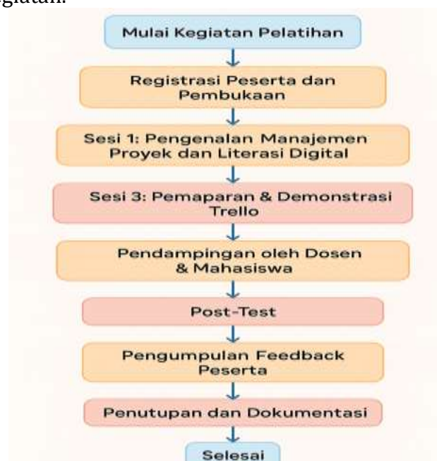
Gambar 2. Diagram Metode Pengabdian Masyarakat

Sebagai bentuk keberlanjutan dari kegiatan ini, tim pengabdian masyarakat juga membuka kanal komunikasi melalui grup daring sebagai sarana konsultasi pasca-pelatihan. Diharapkan dengan adanya forum komunikasi tersebut, peserta dapat terus mengembangkan keterampilannya, saling bertukar pengalaman, dan mendapatkan pendampingan lanjutan jika menemui kendala dalam implementasi aplikasi Trello di lingkungan organisasi mereka. Upaya ini sekaligus memperkuat dampak jangka panjang dari kegiatan pelatihan dan meningkatkan keterlibatan aktif antara universitas dan komunitas lokal. Gambar 2 berikut ini merupakan diagram kerja yang menunjukkan metode pelaksanaan kegiatan.