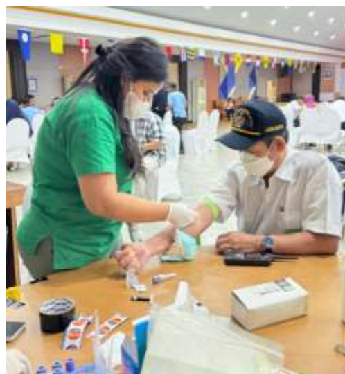
Gambar. 2 Kegiatan Skrining Pemeriksaan Gula Darah