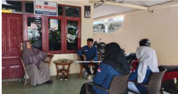
Gambar 3. Melakukan Evaluasi terkait dengan sosialisasi

Langkah terakhir yang dilakukan adalah evaluasi terkait dengan edukasi dan sosialisasi yang dilakukan, apakah informasi yang diberikan sudah jelas dan bisa dipahami.