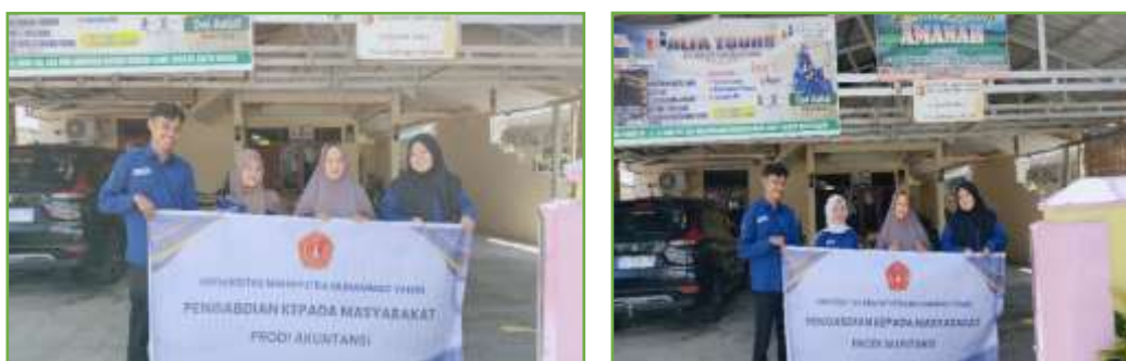
Gambar 2. Tahapan pelaksanaan sosialisasi dengan pemilik Homestay

Kegiatan pengabdian dilakukan dengan memberikan edukasi dan sosialisasi terkait dengan perbandingan keakuratan metode ABC dengan metode Tradisional serta penerapan yang dilakukan pada Homestay Amanah.