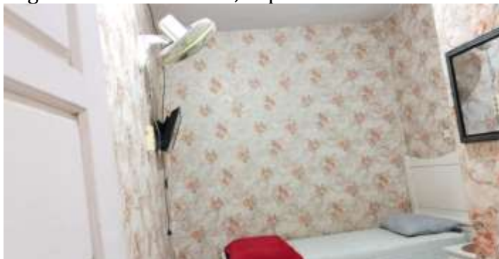
Gambar 4. Fasilitas Kamar Standars