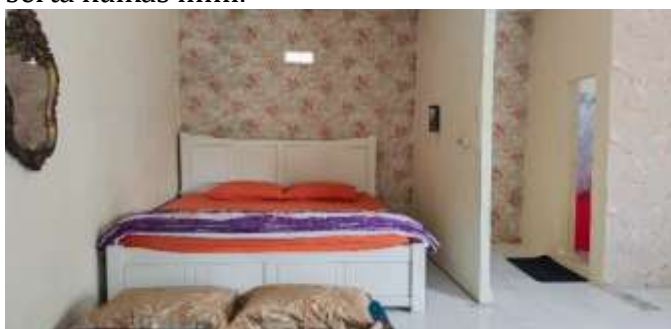
Gambar 6. Fasilitas Kamar Deluxe