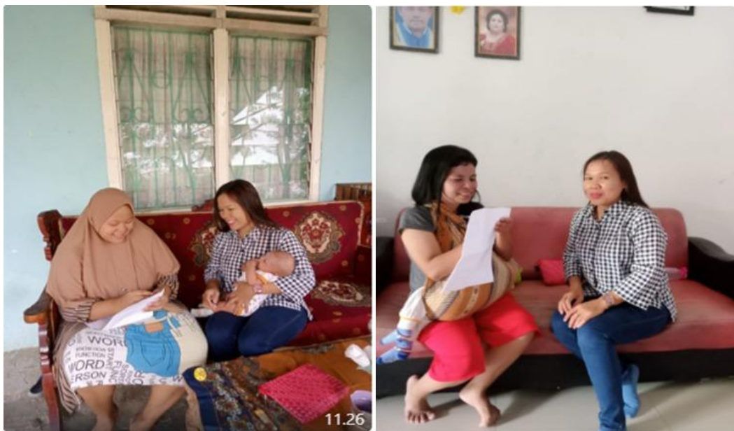
Gambar 1. Edukasi Pemberian ASI Eksklusif

Berdasarkan gambar di atas, kegiatan Edukasi Pemberian ASI Eksklusif bertujuan untuk meningkatkan pemahaman ibu-ibu di Kelurahan Perdagangan III, Kecamatan Bandar, Kabupaten Simalungun, mengenai pentingnya ASI eksklusif dalam mencegah