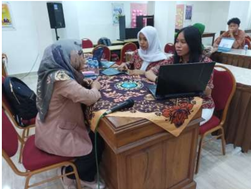
Gambar 3. Pendampingan tim lomba FIKSI SMAN 6 Yogyakarta

Setelah kegiatan pendampingan selesai, tahap selanjutnya yaitu tahap monitoring dan evaluasi. Pada tahap ini dilaksanakan secara online melalui grup WhatsApp. Kegiatan monitoring dilakukan guna menilai efektivitas kegiatan dan kesiapan peserta menghadapi lomba. Setiap tim kelompok akan melaporkan progres pengerjaan profile produk dan dosen pendamping akan memberikan masukan dan mereview terkait progress tersebut. Sedangkan kegiatan evaluasi dilakukan dengan pengisian umpan balik oleh mitra terkait dengan pelaksanaan pendampingan. Umpan balik dari mitra didapatkan hasil bahwa pelaksanaan pendampingan lomba FIKSI berjalan dengan baik.