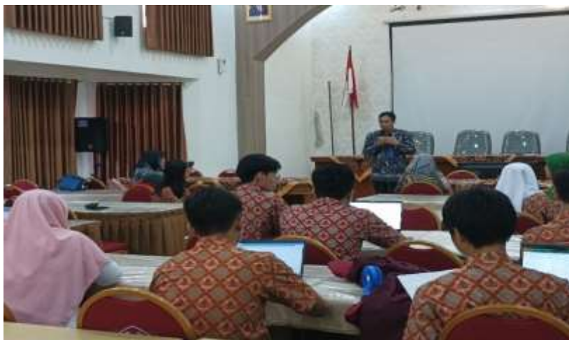
Gambar 2. Sambutan dari Universitas AKPRIND Indonesia oleh Wakil Rektor III