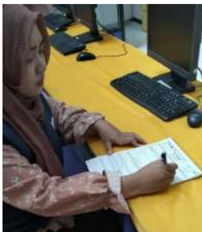
Gambar 2. Pelaporan Pajak wajib pajak orang pribadi Secara Manual

Pendampingan pelaporan pajak bagi WPOP secara manual menggunakan formulir SPT Tahunan 1770 S dan 1770 SS bertujuan untuk memberikan pemahaman dan bimbingan teknis dalam memenuhi kewajiban perpajakan secara tepat, benar, dan sesuai ketentuan yang berlaku. Hal ini terlihat pada Gambar 2, mahasiswa MBKM akan secara langsung mendampingi wajib pajak secara teknis dalam melaporkan SPT Tahunan secara manual untuk meminimalisir terjadinya kesalahan dalam pengisian.