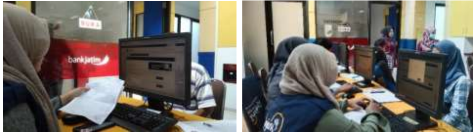
Gambar 4. Edukasi Pelaporan Pajak

Mahasiswa memberikan edukasi terkait tenggat pelaporan, potensi sanksi administratif akibat keterlambatan, serta dampak positif dari kepatuhan pajak terhadap pembangunan nasional. Pendampingan dilakukan secara personal dengan pendekatan komunikatif, menjadikan mahasiswa sebagai jembatan informasi yang efektif antara otoritas pajak dan masyarakat. Melalui komunikasi yang santai dan mudah dipahami, edukasi yang diberikan terasa lebih membaur, sehingga mendorong wajib pajak untuk lebih sadar dan patuh dalam memenuhi kewajibannya. Dengan demikian, keterlibatan mahasiswa MBKM dalam program Renjani tidak hanya memperkuat kualitas layanan di lingkungan KPP, tetapi juga turut membentuk budaya taat pajak di kalangan masyarakat, serta menjadi pengalaman pembelajaran yang bernilai tinggi bagi para mahasiswa.