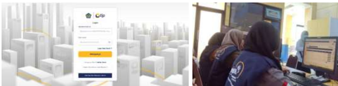
Gambar 1. Pendampingan Pelaporan Pajak Wajib pajak orang pribadi Melalui Web DJP Online

Pendampingan pelaporan pajak wajib pajak orang pribadi (WPOP) dilakukan secara online melalui web DJP Online. Pada proses pendampingan tersebut, relawan pajak ditugaskan untuk mendampingi, mengarahkan, serta membantu melaporkan SPT Tahunan wajib pajak. Sebelum mulai melaporkan SPT Tahunan, wajib pajak dihimbau agar membawa dokumen pendukung, seperti bukti potong pajak (Formulir 1721-A1 atau 1721-A2), fotokopi KTP dan NPWP, rekapitulasi penghasilan tambahan jika ada (misalnya dari usaha, sewa, atau honorarium) untuk memudahkan dalam pelaporan. Sebagaimana terlihat pada Gambar 1, proses pendampingan dilakukan dengan pendekatan personal, di mana mahasiswa menjalin komunikasi langsung dengan wajib pajak untuk memahami kebutuhan, permasalahan, dan kondisi yang dihadapi oleh wajib pajak. Pendekatan ini bertujuan untuk membangun hubungan yang lebih intens dan responsif, sehingga pendampingan dapat berlangsung secara efektif dan sesuai dengan situasi masing-masing wajib pajak.