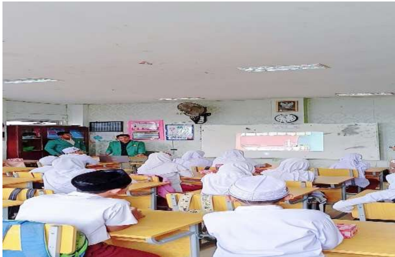
Gambar 2. Menonton video Animasi Bahaya Rokok

mengemukakan kembali apa yang mereka pahami dari tayangan tersebut. Beberapa siswa dengan antusias menceritakan bagian-bagian yang mereka anggap menarik atau menyeramkan, dan dari sana tim pengabdian kembali menegaskan pesan utama video dengan pendekatan dialogis. Kegiatan ini tidak hanya memperkuat pemahaman siswa, tetapi juga melatih kemampuan komunikasi dan berpikir kritis mereka terhadap isu-isu kesehatan. Dengan demikian, pemanfaatan video animasi dalam kegiatan pengabdian ini terbukti menjadi media yang sangat efektif, tidak hanya dalam menyampaikan informasi, tetapi juga dalam membangun pengalaman belajar yang menyenangkan dan memberikan makna bagi anak-anak.