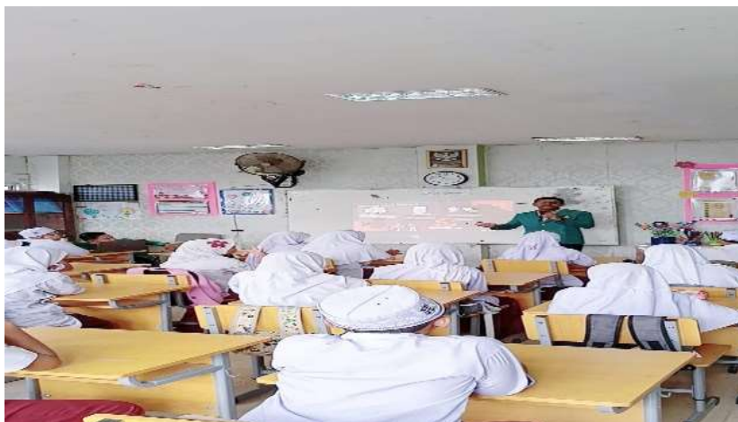
Gambar 1. Edukasi Materi Bahaya Merokok Melalui Lisan

menghindari perilaku merokok. Kegiatan ini juga membuka ruang dialog antara siswa dan tim pengabdian, yang memberikan kesempatan bagi anak-anak untuk bertanya dan menyampaikan pendapat mereka. Dengan cara ini siswa tidak hanya menjadi penerima informasi secara pasif, tetapi juga diajak untuk berpikir kritis dan menyuarakan pemahaman mereka sendiri mengenai bahaya merokok.