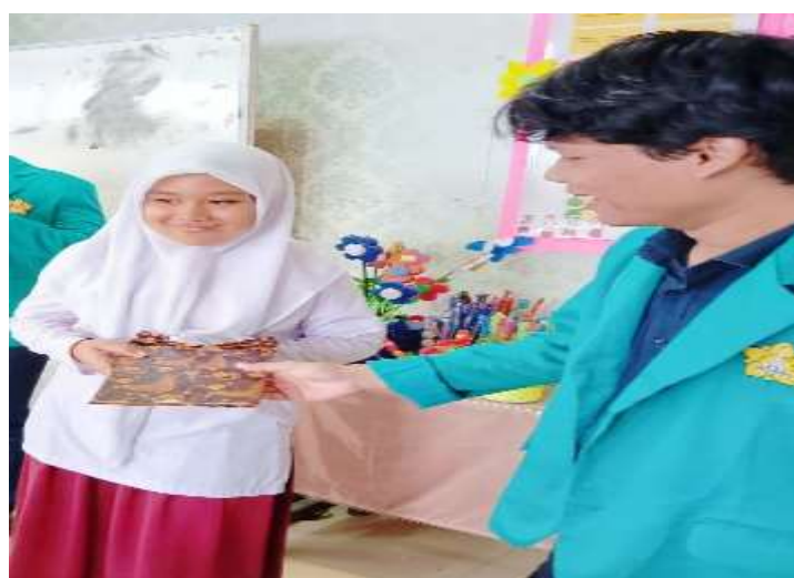
Gambar 3. Pembagian Hadiah Quiz

Berdasarkan evaluasi yang dilakukan, lebih dari 85% siswa mampu menjawab pertanyaan kuis dengan benar. Hal ini menandakan bahwa tujuan utama kegiatan, yaitu untuk mengoptimalkan pengetahuan siswa mengenai bahaya merokok, telah tercapai. Penelitian oleh Lestari & Sari (2020) juga menunjukkan bahwa kuis berhadiah dapat meningkatkan motivasi belajar dan memperkuat retensi pengetahuan pada siswa sekolah dasar. Selain itu, kegiatan ini juga menunjukkan bagaimana evaluasi tidak harus bersifat formal dan membosankan, tetapi dapat dikemas secara kreatif untuk mencapai hasil yang optimal. Dari perspektif pengabdian kepada masyarakat, penggunaan metode evaluatif yang melibatkan unsur permainan dan penghargaan menjadi contoh nyata penerapan prinsip edukasi yang humanis dan berorientasi pada pengalaman belajar yang bermakna ( meaningful learning ). Hal ini dapat menjadi model pendekatan edukatif alternatif yang relevan diterapkan dalam kegiatan serupa di masa mendatang, khususnya untuk topik-topik preventif dalam bidang kesehatan masyarakat.