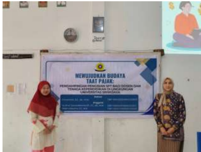
Gambar 3. Dokumentasi Persiapan Pengabdian

untuk Negeri (Renjani) tahun 2025. Mahasiswa tersebut telah mendapatkan pelatihan intensif, baik teknis maupun etika pelayanan, sehingga mampu memberikan bantuan yang akurat dan profesional kepada para wajib pajak.