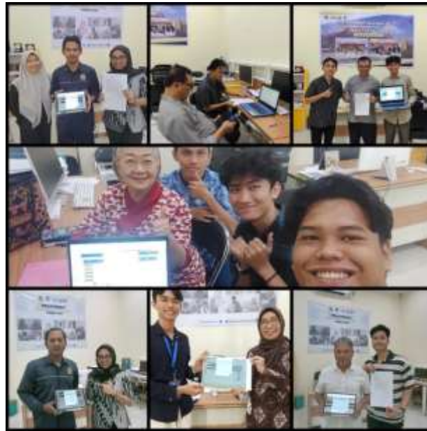
Gambar 4. Pendampingan Pengisian SPT Tahunan

Pendampingan pengisian SPT Tahunan untuk tahun pajak 2024 dilakukan melalui situs web djponline.pajak.go.id dengan fitur e-filing. Dengan menggunakan e-filing untuk pengisian dan pelaporan SPT, diharapkan Wajib Pajak dapat melakukan pelaporan SPT Tahunannya dengan lebih real-time , efektif, dan efisien. Wajib Pajak, baik dosen maupun tenaga kependidikan, yang memanfaatkan kegiatan pendampingan pengisian dan pelaporan SPT tahunan berjumlah 202 orang. Pendampingan dilakukan secara daring dan luring di lokasi yang tercantum dalam flyer atau pamflet. Sebelum melakukan pengisian dan pelaporan SPT Tahunan, wajib pajak diminta untuk menyiapkan dokumen dan data untuk mempermudah Wajib Pajak dalam melakukan pelaporan SPT Tahunan. Dokumen dan data tersebut mencakup: