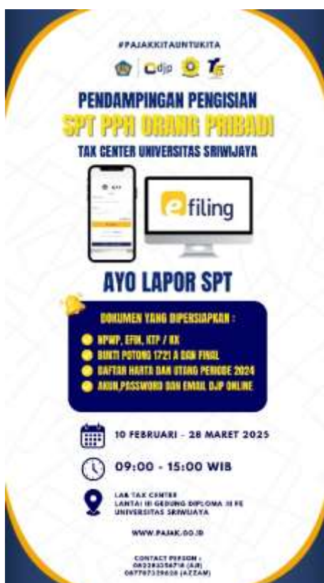
Gambar 2. Flyer

Kegiatan pengabdian ini diawali dengan pembuatan flyer atau pamflet sebagai media untuk menyampaikan informasi terkait asistensi pelaporan SPT kepada para dosen dan tenaga kependidikan di lingkungan Universitas Sriwijaya, seperti yang terlihat pada Gambar 2. Dengan adanya flyer atau pamflet tersebut, diharapkan kegiatan ini diikuti oleh seluruh dosen dan tenaga kependidikan di lingkungan Universitas Sriwijaya.