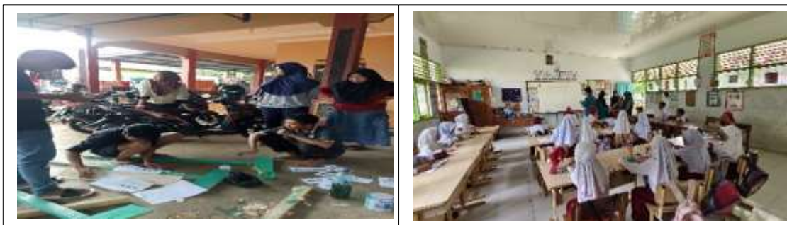
Gambar. 3 Persiapan dan Survei (Analisis Kebutuhan) Program Teras Belajar

Kemudian waktu pelaksanaan dilaksanakan dua kali seminggu setiap jam 16.00 WITA - 17.30 WITA, dengan metode yang menyenangkan dan media yang dapat menarik minat baca anak-anak, seperti kartu huruf, kartu angka, puzzle, serta bahan bacaan yang menarik minat baca anak-anak, dan disesuaikan dengan tingkat umur serta kemampuan membaca anak. Berikut gambar kegiatan survei awal dan persiapan.