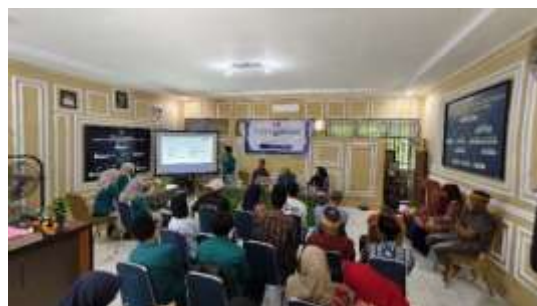
Gambar. 5 Sosialisasi Peran Orang Tua dalam Mendampingi Literasi Anak

Terakhir, dilakukan sosialisasi kepada orang tua mengenai pentingnya peran mereka dalam mendukung anak membangun budaya membaca di rumah serta strategi efektif dalam mendampingi kegiatan literasi. Selanjutnya, dalam sesi diskusi, tim PKM memberikan berbagai tips kepada orang tua tentang cara menciptakan lingkungan yang kondusif untuk perkembangan literasi anak secara optimal. Kegiatan ini dapat dilihat pada gambar berikut.