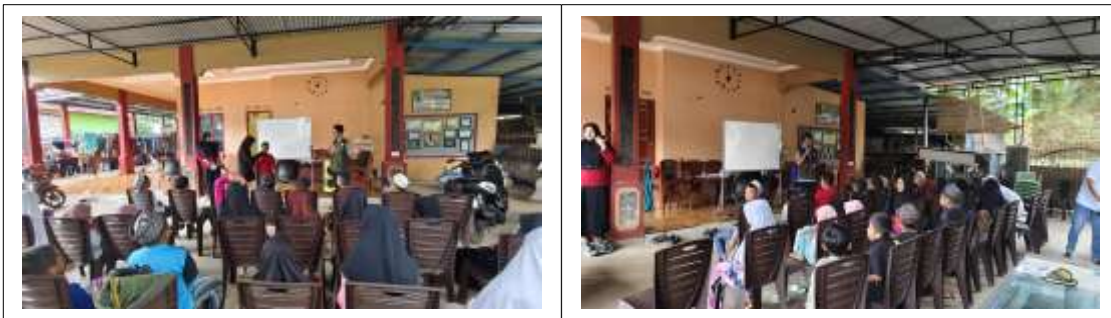
Gambar. 4 Pelaksanaan Program Teras Belajar

Dalam pelaksanaan juga dilakukan diskusi dan permainan literasi yang menyenangkan melalui berbagai aktivitas edukatif. Kegiatan ini tidak hanya melatih keterampilan literasi, tetapi juga membangun rasa kebersamaan dan semangat belajar dalam suasana yang menyenangkan. Selain itu, diadakan juga sesi diskusi, di mana anak-anak berdiskusi tentang buku yang telah dibaca, bermain tebak kata, serta menyusun kata bersama menggunakan kartu huruf dan kartu angka. Permainan yang dilakukan dapat meningkatkan daya ingat dan pemahaman bacaan seperti mencari kata tersembunyi dan mencocokkan kata dengan gambar. Hal ini sejalan dengan hasil penelitian yang menyatakan bahwa mengajarkan anak membaca dengan permainan meningkatkan hasil belajar peserta didik (Tyas et al., 2023). Proses pelaksanaan program dapat dilihat pada gambar berikut.