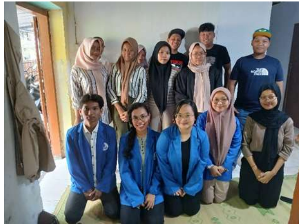
Gambar 6. Foto Evaluasi Sosialisasi Pajak Bumi dan Bangunan Bersama Karang Taruna

Sosialisasi ini memiliki karakteristik yang inklusif dan partisipatif. Selain penyampaian materi, terdapat sesi diskusi dan tanya jawab yang memungkinkan peserta untuk berbagi pengalaman dan pandangan mereka mengenai PBB. Menurut Yulianti (2022), kegiatan sosialisasi yang melibatkan diskusi dapat meningkatkan rasa kepemilikan peserta terhadap materi yang disampaikan, sehingga mendorong mereka untuk lebih aktif berpartisipasi.