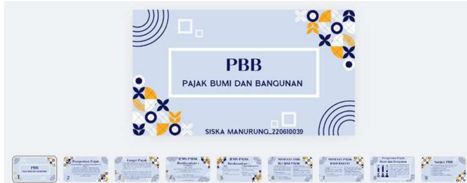
Gambar 4. Foto Perancangan Materi Mengenai Pajak Bumi dan Bangunan

menunjukkan bahwa penyampaian materi yang sistematis dan terstruktur dapat meningkatkan pemahaman peserta. Selain itu, materi juga dilengkapi dengan studi kasus dan contoh nyata untuk memudahkan pemahaman.