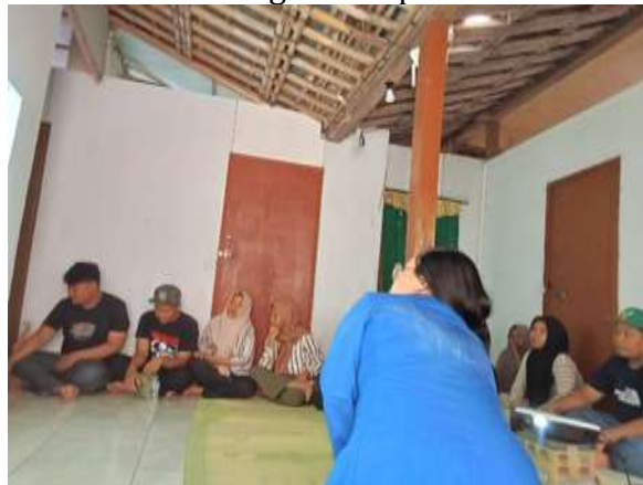
Gambar 5. Foto Sosialisasi Kepada Karang Taruna Karanglo

Sosialisasi yang dilaksanakan diikuti oleh 10 anggota Karang Taruna dan berlangsung interaktif. Peserta menunjukkan antusiasme yang tinggi, dengan banyak pertanyaan yang diajukan mengenai PBB. Hasil sosialisasi ini sejalan dengan temuan dari Rahayu (2022), yang menyatakan bahwa sosialisasi yang melibatkan partisipasi aktif dari audiens lebih efektif dalam meningkatkan pemahaman tentang pajak.