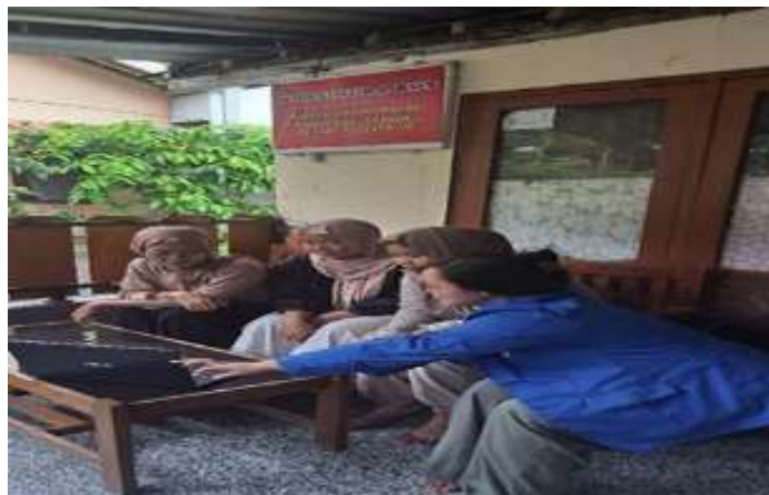
Gambar 3. Foto Observasi dengan Karang Taruna Karanglo

Hasil observasi awal menunjukkan bahwa pemahaman masyarakat, khususnya anggota Karang Taruna di Desa Karanglo, mengenai Pajak Bumi dan Bangunan (PBB) masih rendah. Banyak anggota yang belum memahami pentingnya PBB dan bagaimana pengelolaannya dapat berdampak pada pembangunan desa. Penelitian oleh Sari dan Nugroho (2022) menegaskan bahwa pemahaman yang rendah tentang pajak di kalangan generasi muda dapat menghambat partisipasi mereka dalam pembangunan daerah.