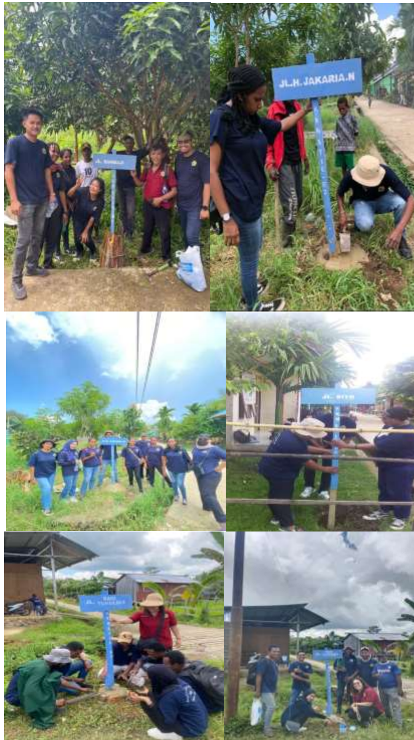
Gambar 3. Pemasangan Papan Nama Jalan