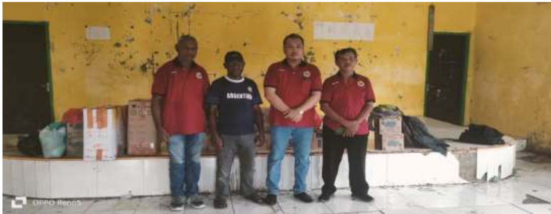
Gambar 4 . Persiapan penyerahan pakaian layak pakai