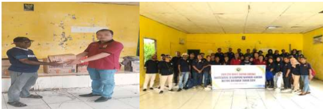
Gambar 5. Penyerahan Pakaian Layak Pakai kepada Aparat Kampung