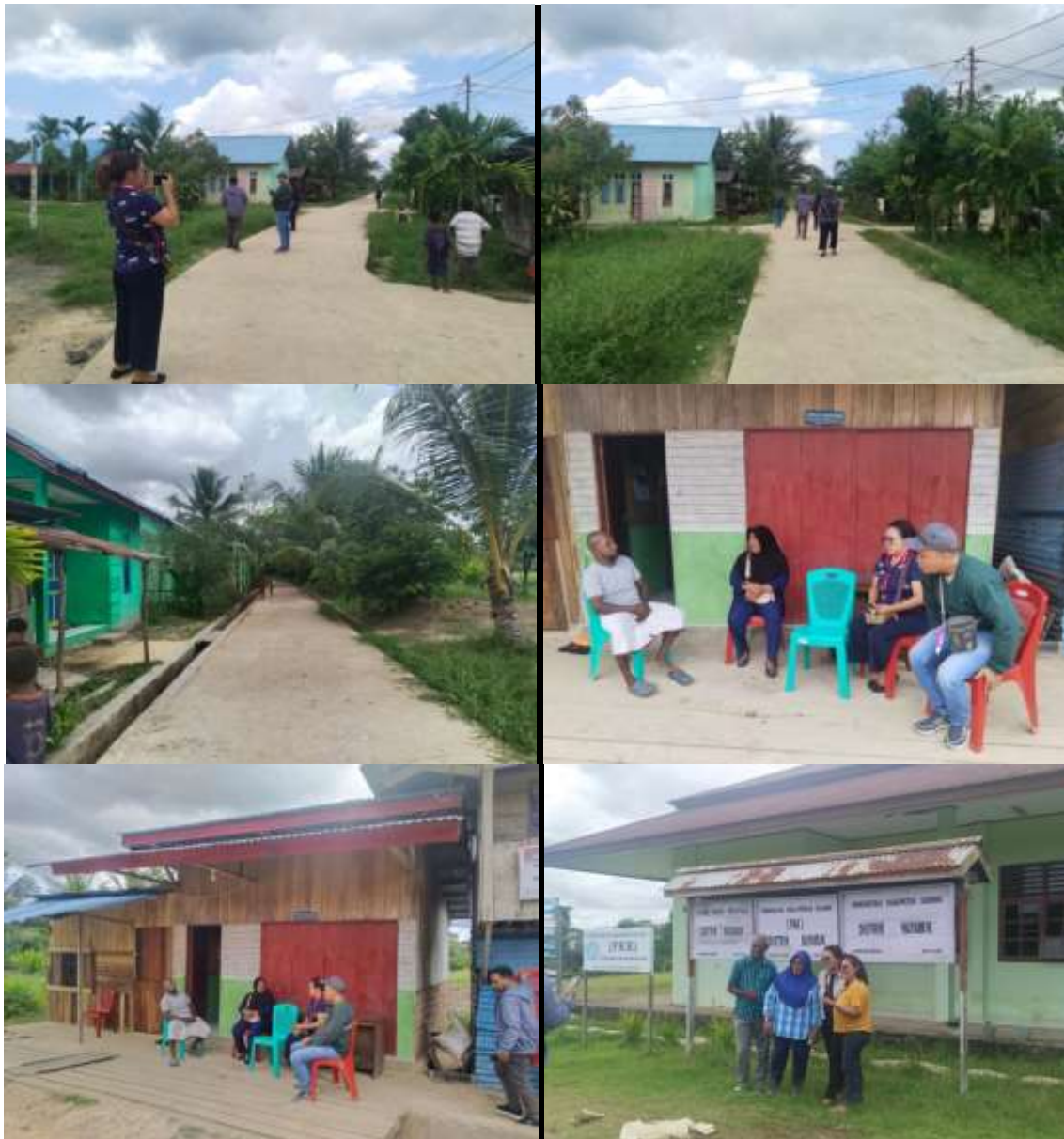
Gambar 1. Kondusi Survey Lokasi

PkM dilaksanakan dari tanggal 19 Maret hingga 18 april 2024. Kegiatan pengabdian kepada masyarakat (PkM) di kolaborasikan dengan kegiatan kuliah kerja nyata (KKN). Kami memberikan informasi kepada warga dan perangkat Kampung Warmon Kokoda tentang pemasangan papan nama jalan dan pebagian pakaian layak pakai. Papan nama digunakan untuk membantu orang-orang di kampung dan dari luar kampung untuk mengetahui tentang jalan, lokasi perangkat kampug, dan informasi lainnya. Papan nama jalan dibuat sebanyak 5 unit dan dipasang pada jalan utama satu unit dan empat lainnya dipasang pada lorong atau gang. Jalan-jalan tersebut antara lain jalan Warmon (Jalan Utama), jalan Sangaji, jalan Sito, jalan H. Jakaria, dan jalan Said Tuhulele, berada di Kampung Warmon Kokoda, Distrik Mayamuk, Kabupaten Sorong. Gambar 2 menunjukkan prosedur yang digunakan untuk mendesain dan membuat papan nama jalan.