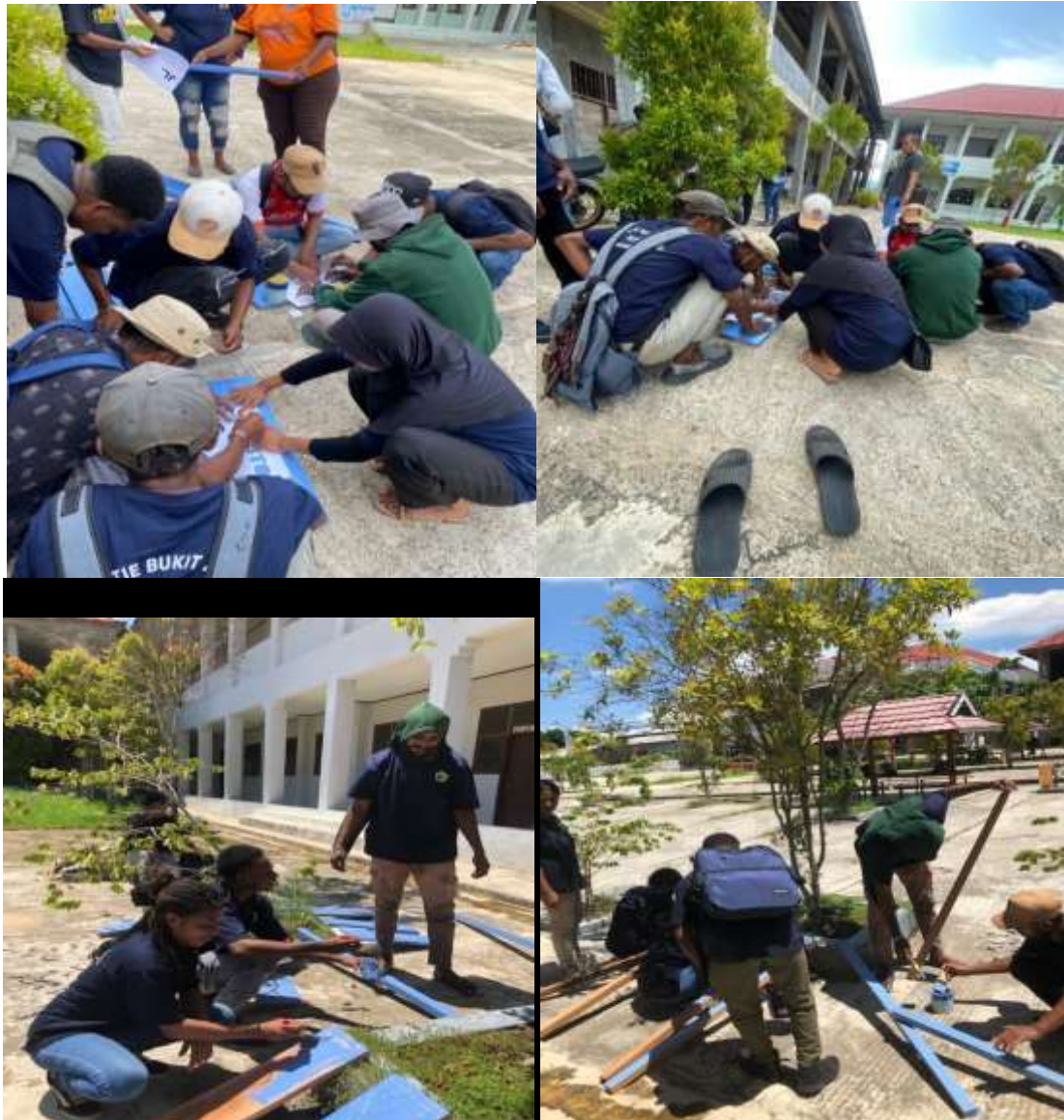
Gambar 2. Penyiapan Papan Nama Jalan