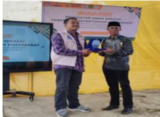
Gambar 5. Penyerahan Plakat

tanggapan, tetapi juga menunjukkan kreativitas dan komitmen luar biasa dalam menyelesaikan berbagai tugas yang diberikan. Narasumber merasa sangat terinspirasi oleh semangat serta dedikasi peserta dalam mengikuti setiap sesi kegiatan terkait pemanfaatan digitalisasi untuk berwirausaha. Selama kegiatan, peserta aktif berpartisipasi dalam sesi tanya jawab, yang membantu fasilitator mengidentifikasi aspek-aspek yang masih membutuhkan penjelasan lebih lanjut.