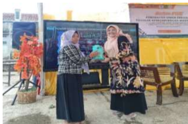
Gambar 4. Penyerahan Reward Peserta

Sebanyak 85% pelaku UMKM yang mengikuti pelatihan mengungkapkan bahwa mereka kini merasa lebih siap dan percaya diri untuk mengintegrasikan teknologi digital dalam kegiatan operasional usaha mereka. Hal ini terutama terkait dengan penggunaan teknologi dalam proses pemasaran dan manajemen bisnis, yang sebelumnya mungkin mereka anggap sulit. Kegiatan sosialisasi ini memberikan pemahaman yang lebih mendalam mengenai cara-cara yang dapat digunakan untuk mengoptimalkan teknologi digital guna meningkatkan efisiensi, memperluas jangkauan pasar, dan mengelola bisnis dengan lebih efektif. Sebagai hasilnya, peserta merasa lebih mampu menghadapi tantangan di era digital dan memanfaatkan peluang yang ada untuk mengembangkan usaha mereka. Berikut dokumentasi Narasumber dan pelaku UMKM serta masyarakat Desa Jaya Mekar pada saat mengikuti seminar Pemanfaatan Digitalisasi dalam berwirausaha.