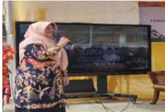
Gambar 3 Pemaparan Materi oleh Narasumber

Selanjutnya pemaparan materi Pemanfaatan Digitalisasi dalam berwirausaha di era industri 4.0 oleh Narasumber dari salah satu perwakilan Dosen Program Studi Manajemen Universitas Cipasung Tasikmalaya. Pemaparan ini berfokus pada pemanfaatan digitalisasi untuk mendukung wirausaha di kalangan Usaha Mikro, Kecil, dan Menengah (UMKM) memberikan hasil yang signifikan dalam meningkatkan pemahaman dan kemampuan digital peserta.