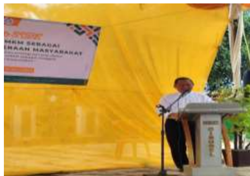
Gambar 2. Sambutan Perwakilan Desa

Kegiatan pengabdian kepada masyarakat ini diikuti oleh 40 peserta yang terdiri dari 19 orang dari pelaku UMKM, 3 orang dari Aparatur Desa, 15 orang dari perwakilan mahasiswa serta 3 orang perwakilan dosen Universitas Cipasung Tasikmalaya. Sesi ini dimulai dengan sambutan dari perwakilan Aparatur Desa yang menjelaskan secara rinci agenda sosialisasi dan tujuan kegiatan pengabdian ini. Sambutan tersebut bertujuan memberikan gambaran kepada peserta mengenai manfaat digitalisasi dalam pengembangan UMKM, materi yang akan disampaikan, serta harapan yang diinginkan dari pelaksanaan kegiatan. Dengan penjelasan ini, peserta diharapkan dapat memahami arah kegiatan dan mengikuti acara dengan lebih fokus dan antusias.