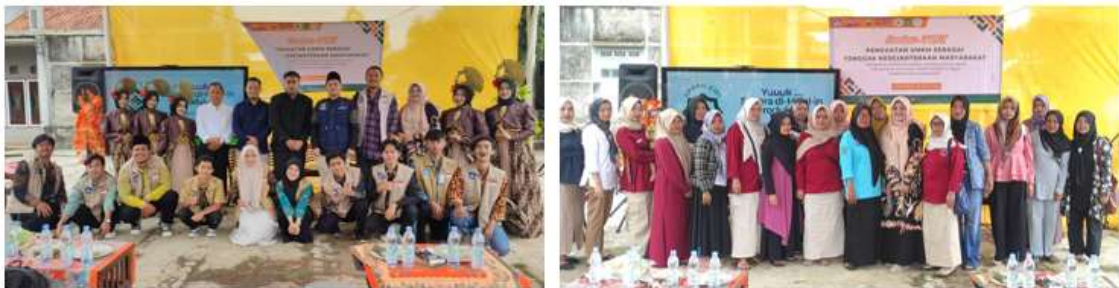
Gambar 6. Foto bersama Peserta

Mayoritas peserta menunjukkan minat besar terhadap penggunaan platform e-commerce dan media sosial sebagai alat pemasaran. Selain itu, aplikasi manajemen bisnis yang diperkenalkan juga mendapatkan respon positif, dengan banyak peserta yang merasa teknologi tersebut dapat meningkatkan efisiensi operasional usaha mereka. Dengan penghargaan ini, diharapkan semakin banyak masyarakat yang termotivasi untuk memperluas wawasan digitalisasi, sehingga dapat memberikan dampak positif bagi perkembangan UMKM di masa depan.