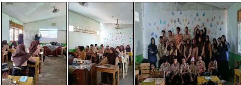
Gambar.2 Pelaksanaan Pengabdian Psikoedukasi

Kegiatan pengabdian kepada masyarakat ini merupakan kerjasama pengabdian dengan mitra yaitu pendidik di MTs Tawangrejo Sari yang mana salah satu sekolah berbasis agama islam di Kota Semarang. Peserta yang menjadi sasaran adalah seluruh siswa/i kelas VII, VII dan IX dengan waktu dan tempat pelaksanaan yang sama. Adapun hasil dokumentasi kegiatan pengabdian kepada masyarakat sebagai berikut :