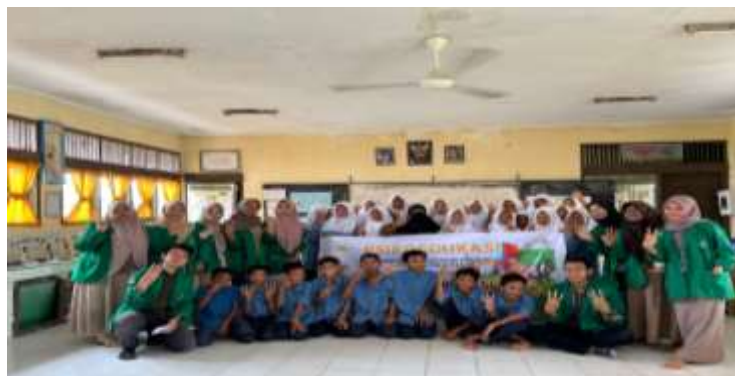
Gambar : Foto bersama peserta pelatihan