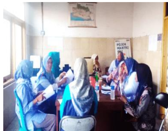
Gambar 3. Diskusi dan Sosialisasi Kegiatan dengan Mitra

Setelah berdiskusi dengan tim pelaksana disepakati timeline yang akan dilakukan yaitu pada kegiatan Bulan ke-2 yaitu Bulan Agustus 2023 tim pelaksana melakukan kunjungan dan diskusi dengan mitra terkait pemaparan rencana kegiatan pengabdian masyarakat yang akan dilaksanakan di Desa Gebang Ilir Kecamatan Gebang Kabupaten Cirebon (Gambar 3). Pada kegiatan sosialisasi tersebut di hadiri oleh pengurus inti Tim Penggerak PKK Desa Gebang Ilir yaitu sebanyak 10 peserta. Materi yang disampaikan yaitu tentang tujuan dan manfaat kegiatan pengabdian masyarakat yang akan dilaksanakan di Desa Gebang Ilir, agenda pelatihan pemanfaatan garam laut menjadi produk kreatif sabun cair NU