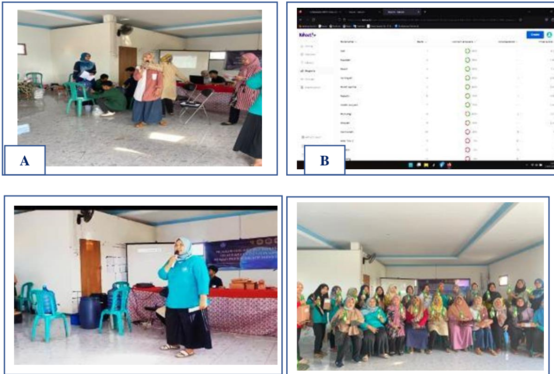
Gambar 8. Rangkaian Kegiatan Akhir Pelatihan Tahap Kedua Bersama Mitra Tim Penggerak PKK Desa Gebang Ilir Kecamatan Gebang Kabupaten Cirebon

Pada saat kegiatan pendampingan awal di Bulan Oktober 2023, mitra telah memproduksi sabun cair NU Klin sebanyak 180 liter atau berkisar 400 pcs sabun cair NU Klin kemasan botol dan produknya saat ini telah diterima oleh masyarakat dengan menghasilkan omset penjualan sebesar Rp. 2.200.000. Selain itu mitra juga sudah dapat membuat label kemasan sabun NU Klin yang menarik dan menerapkan pembuatan sabun cair NU Klin menggunakan Alat Teknologi Tepat Guna (TTG) secara mandiri, menurut mitra alat tersebut mudah digunakan atau dioperasikan dengan daya listrik 135 watt dan membantu mitra dalam proses pembuatan sabun cair NU Klin karena memiliki kapasitas produksi yang cukup besar yaitu mencapai 60 Liter atau 133 pcs kemasan botol sabun cair NU Klin per produksi. Namun dalam melakukan akses pemasaran digital ( digital marketing ) perlu dilaksanakan pada agenda pendampingan berikutnya. Dan selanjutnya pada kegiatan pendampingan berikutnya Tim Penggerak PKK Desa Gebang Ilir akan dibentuk kelompok usaha pengolah dan pemasar (POKLAHSAR) produk sabun cair NU Klin komoditas pengolahan garam non konsumsi yang berkolaborasi dengan pemerintah setempat serta akan dibimbing oleh Penyuluh Perikanan Kecamatan Gebang dari BRPBATPP Kementerian Kelautan dan Perikanan Republik Indonesia sebagai kelompok binaan dalam akses pemasarannya untuk peningkatan pendapatan kelompok mitra.