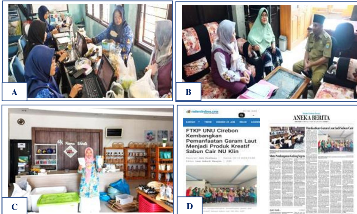
Gambar 6. Sinergitas Pentahelix ABGCM dalam Kegiatan Pengabdian Masyarakat di Desa Gebang Ilir ; (a) Koordinasi Bersama Penyuluh Perikanan, (b) Koordinasi Bersama Kepala Desa dan Ketua PKK Gebang Ilir, (c) Koordinasi di Rama Shinta, (d) Publikasi Kegiatan di Media Massa

optimasi peran dari unsur Akademisi, Bisnis, Pemerintah, Komunitas dan Media sebagai pendorong perubahan inovasi, kreatifitas dan produktivitas yang dapat memberikan manfaat bagi Mitra PKK dan masyarakat sekitar Desa Gebang Ilir.