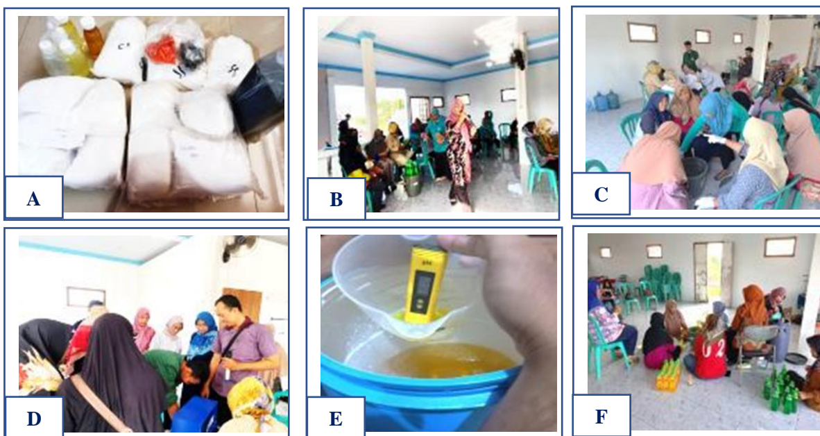
Gambar 7. Rangkaian Kegiatan Hari Kedua ; (a) Persiapan Bahan Dasar Praktek Pembuatan Sabun Cair NU Klin, (b) Penjelasan Instrktur tentang Prosedur Pembuatan Sabun NU Klin, (c) Praktek Pembuatan Sabun NU Klin, (d) Penerapan Pembuatan Sabun NU Klin menggunakan Alat TTTG, (e) Uji PH Sabun Cair NU Klin, (f) Pengemasan Sabun Cair NU Klin

Kelompok mitra mengalami peningkatan pengetahuan tentang nama bahan-bahan dan fungsi bahan kimia yang digunakan dalam pembuatan sabun cair NU Klin meningkat, selain itu mitra juga memahami tentang standar nilai pH sabun cair cuci piring yang harus sesuai dengan SNI 2588–2017 yaitu pH berkisar antara 6-11. Namun setelah kegiatan pelatihan ini mitra masih membutuhkan pendampingan lanjutan dari tim pelaksana pengabdian masyarakat Fakultas Teknologi Kelautan dan Perikanan UNU Cirebon dalam persiapan bahan-bahan dan penerapan proses pembuatan sabun cair NU Klin menggunakan alat teknologi tepat guna mesin mixing movable liquid sesuai dengan prosedur. Adapun kegiatan akhir pelatihan tahap kedua di tutup dengan (a) diskusi (tanya jawab), (b) evaluasi ( post test ) kuis kahoot, (c) testimoni perwakilan peserta dan dilanjutkan (d) kegiatan foto bersama (Gambar 8).