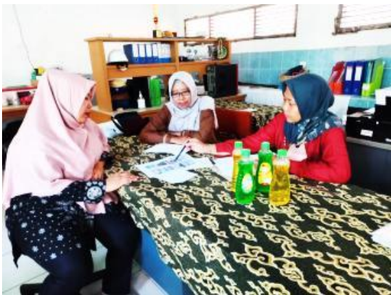
Gambar 2. Diskusi dengan Tim Pelaksana Pengabdian Masyarakat

Sebelum melaksanakan kegiatan pelatihan dan serah terima alat teknologi tepat guna, pada kegiatan bulan ke-1 yaitu Bulan Juli 2023 tim pelaksana melakukan diskusi dan merancang timeline dengan seluruh anggota untuk membahas mengenai program kegiatan pengabdian masyarakat yang akan dilaksanakan di Desa Gebang Ilir Cirebon (Gambar 2).