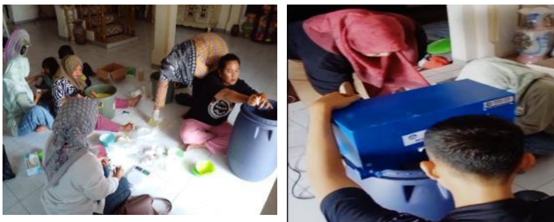
Gambar 9. Kegiatan Pendampingan Pembuatan Sabun Cair NU Klin

Berdasarkan hasil pengamatan pelatihan, pre test dan post test (evaluasi pelatihan) serta monitoring ketika pendampingan (Tabel 1), peningkatan pemberdayaan Tim Penggerak PKK sebagai mitra pengabdian masyarakat melalui kegiatan pelatihan pembuatan sabun cuci piring NU Klin di Desa Gebang Ilir telah tercapai peningkatan pengetahuan mitra dalam pemanfaatan garam laut menjadi produk kreatif sabun cair NU Klin dengan rata-rata sebesar 78-95%, dan telah tercapai peningkatan keterampilan mitra dalam pemanfaatan garam laut menjadi produk kreatif sabun cair NU Klin dengan rata-rata sebesar 80-90%. Peserta menunjukkan keinginan yang kuat untuk mengembangkan keterampilan wirausaha dan menggunakan pelatihan ini sebagai langkah awal menuju kesuksesan dalam dunia usaha. Saat ini mitra sudah mampu menghitung Harga Pokok Produksi (HPP) penjualan sabun cair NU Klin dan telah memiliki pendapatan usaha dari penjualan produk kreatif sabun cair NU Klin dengan pemasaran di daerah Kecamatan Gebang dan sekitarnya. Namun masih sedikit terkendala dengan persiapan bahan tambahan lainnya dalam pembuatan sabun cair NU Klin seperti texapon dan EDTA yang pada saat itu sedang tidak tersedia di Toko Kimia terdekat sehingga mitra mencari alternatif untuk pembelian bahan-bahan kimia lainnya di toko online.