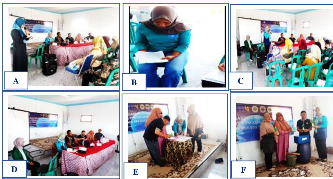
Gambar 5. Kegiatan Pelatihan Hari Pertama Bersama Mitra ; (a) Pembukaan, (b) Pre Test Peserta Pelatihan, (c) Sambutan Ketua Pelaksana, (d) Sambutan Kepala Desa Gebang Ilir dan Ketua Tim Penggerak PKK, (e) Penandatanganan MOU Kegiatan Pengabdian Masyarakat, (f) Serah Terima Aset TTG

Adapun hasil rangkaian kegiatan pelatihan tahap pertama yaitu dilanjutkan dengan Pemaparan Materi Pelatihan dan Penyuluhan dari Narasumber, Diskusi dan Evaluasi sebagai respon atau feedback peserta dan diakhiri dengan kegiatan Foto Bersama Mitra setelah selesainya kegiatan penyuluhan. Pada kegiatan diskusi atau tanya jawab para peserta sangat aktif bertanya kepada pemateri diantaranya yaitu tentang prosedur dan manfaat dari pembentukan kelompok usaha pengolah dan pemasar (POKLAHSAR) perikanan dan bertanya mengenai analisa usaha penetapan harga pokok produksi sabun cair NU Klin, prosedur pembuatan serta cara pembuatan label kemasan sabun cair NU Klin. Kegiatan ini dilakukan secara terstruktur, menarik, dan interaktif dikarenakan peserta merasa senang dikarenakan belum pernah memperoleh kegiatan penyuluhan dan pelatihan pembuatan sabun cair, terutama sabun cuci piring merupakan kebutuhan rumah tangga yang digunakan sehari-hari sehingga mitra terbuka wawasannya dan termotivasi untuk dapat mengembangkan usaha sabun NU Klin bersama kelompok PKK di Desa Gebang Ilir.