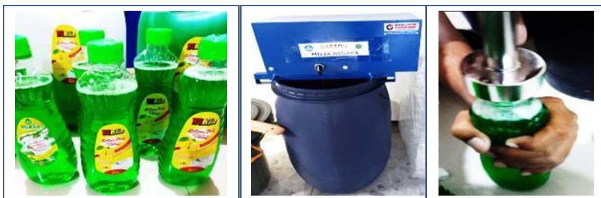
Gambar 4. Produk Sabun Cair NU Klin dan Alat Teknologi Tepat Guna

Pada acara sosialisasi dijelaskan mengenai potensi garam laut sebagai bahan dasar pembuatan sabun cuci piring NU Klin dan memperlihatkan produk contoh sabun cuci piring NU Klin. Selain itu dijelaskan juga mengenai fungsi dan spesifikasi alat teknologi tepat guna yang nanti akan diserahkan kepada mitra (Gambar 4) . Acara tersebut disambut baik oleh Kelompok Ibu PKK Desa Gebang Ilir sebagai mitra dan Pemerintah Desa Gebang Ilir terlihat dengan antusias peserta yang sangat interaktif dalam kegiatan tersebut. Selain itu pada kegiatan sosialisasi juga dilakukan diskusi mengenai kegiatan rutin PKK yang sudah dilaksanakan dan harapan mitra dalam kegiatan pengabdian masyarakat. Mitra berharap kegiatan pendampingan dapat terus berjalan serta dapat meningkatkan pendapatan usaha bagi kesejahteraan kelompok Ibu PKK di Desa Gebang Ilir. Kegiatan pelatihan pemanfaatan garam laut menjadi produk kreatif sabun NU Klin dilaksanakan selama dua tahap yaitu pada tanggal 22 dan 23 September 2023 berlokasi di Desa Gebang Ilir Kecamatan Gebang Kabupaten Cirebon. jumlah peserta pelatihan yang hadir yaitu sebanyak 25 peserta yang merupakan pengurus dan anggota Tim Penggerak PKK Desa Gebang Ilir.