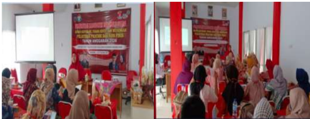
Gambar 3. Diskusi dan sharing dengan peserta

Kegiatan ini juga melibatkan peran aktif dari peserta dengan berdiskusi tentang permasalahan yang mereka alami saat ini. Peserta secara bergantian mengungkapkan permasalahan tentang produk mereka seperti masalah laporan keuangan, pemasaran produk ( Gambar 3)