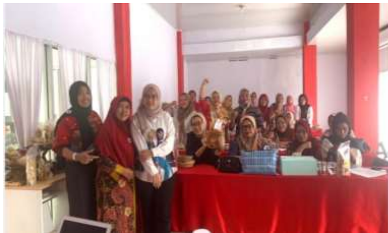
Gambar 4. Foto bersama antara pihak penyelenggara dan peserta