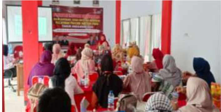
Gambar 2. Penyampaian materi Pelatihan

Kegiatan ini dilaksanakan selama 3 hari di kantor PLUT Kabupaten Bengkulu Utara dengan materi pelatihan meningkatkan kapasitas pelaku UMKM dalam bidang akses dan literasi keuangan (Gambar 2).