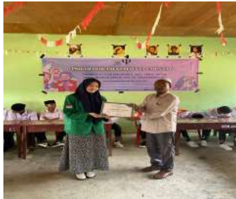
Gambar 2. Penyerahan sertifikat kepada kepala Madrasah Jabal nur, Paloh Lada

Hasil penelitian yang ditunjukkan dalam Gambar 2 menggambarkan momen penyerahan sertifikat kepada Kepala Madrasah Jabal Nur, Paloh Lada. Penyerahan sertifikat ini menandai apresiasi atas partisipasi dan kontribusi Madrasah Jabal Nur dalam kegiatan psikoedukasi yang telah dilaksanakan. Momen ini menjadi simbol pengakuan atas usaha dan kerja sama yang baik antara penyelenggara kegiatan dengan pihak madrasah dalam mendukung kesehatan mental remaja. Acara penyerahan sertifikat ini dilakukan dengan suasana yang khidmat, dihadiri oleh para siswa, pengajar, dan pihak terkait lainnya. Sertifikat tersebut tidak hanya berfungsi sebagai penghargaan, tetapi juga sebagai motivasi bagi madrasah untuk terus mengembangkan program-program yang mendukung kesejahteraan mental dan emosional siswa. Dalam konteks ini, sertifikat menjadi bukti nyata komitmen Madrasah Jabal Nur dalam meningkatkan kualitas pendidikan yang memperhatikan aspek kesehatan mental. Selama penyerahan, Kepala Madrasah Jabal Nur menyampaikan beberapa kata sambutan yang menggambarkan pentingnya kegiatan psikoedukasi ini bagi siswa. Ia menekankan bahwa regulasi emosi merupakan keterampilan yang sangat diperlukan di masa remaja, terutama dalam menghadapi berbagai tantangan yang muncul baik di sekolah maupun di rumah. Pernyataan ini menunjukkan dukungan penuh dari pihak madrasah terhadap upaya-upaya yang diarahkan untuk meningkatkan kesehatan mental siswa.