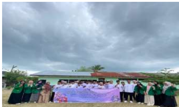
Gambar 3. Pelaksanaan psikoedukasi

Hasil penelitian yang ditunjukkan dalam Gambar 3 menggambarkan pelaksanaan psikoedukasi yang berlangsung dalam suasana interaktif dan produktif. Kegiatan ini merupakan bagian penting dari program yang bertujuan untuk meningkatkan kemampuan remaja dalam meregulasi emosi mereka, khususnya siswa di tingkat SMP. Selama sesi psikoedukasi, para peserta didik tampak antusias dan aktif terlibat dalam proses pembelajaran. Pada tahap ini, pemateri menyampaikan materi dengan menggunakan berbagai metode yang menarik, seperti presentasi visual, diskusi kelompok, dan simulasi. Pendekatan ini dirancang untuk memfasilitasi pemahaman yang lebih baik tentang strategi efektif dalam mengelola emosi. Siswa diajak untuk berpartisipasi aktif, berbagi pengalaman pribadi, dan mendiskusikan berbagai tantangan yang mereka hadapi terkait emosi dan kesehatan mental. Keterlibatan langsung siswa dalam sesi ini membantu mereka merasa lebih terhubung dengan materi, serta meningkatkan rasa percaya diri mereka dalam mengungkapkan pendapat.