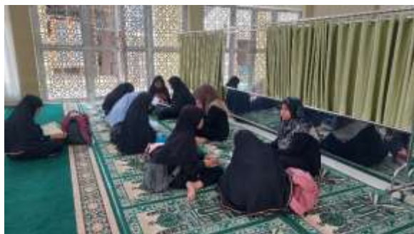
Gambar. 3 Pelaksanaan pendampingan ekstrakurikuler tahfiz

meperbaiki bacaan tersebut, dan jika sudah hafal dengan lancar dan benar maka peserta didik wajib menyetorkan kembali hafalannya.