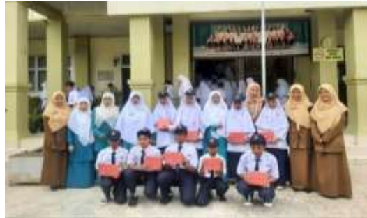
Gambar. 5 Pemberian reward kepada peserta didik.

menghafal. Hal ini merupakan evaluasi guna untuk mengetahui sejauh mana peserta didik mampu menjaga hafalan yang mereka miliki.