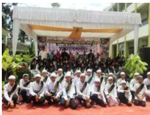
Gambar. 7 Pelaksanaan wisuda ekstrakurikuler tahfiz

Pada tahap evaluasi ini peserta didik diminta menyetorkan hafalannya sesuai ayat yang dihafal dalam juz 30 dihadapan guru pendamping secara bergantian setiap pertemuan. Jadi dengan menyetorkan hafalan ayat tersebut guru pendamping dapat mengukur kualitas hafalan peserta didik apakah peserta didik benar-benar sudah hafal dan lancar atau belum. Setelah menyetorkan hafalan kepada guru pendamping selanjutnya peserta didik menyetorkan hafalannya kepada pembina ekstrakurikuler tahfiz untuk seleksi kualitas hafalan dan bacaan peserta didik. Bagi peserta didik yang telah menuntaskan seluruh hafalan juz 30 maka peserta didik berhak mengikuti wisuda tahfiz periode ke 2 pada bulan desember 2023.