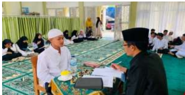
Gambar. 6 Proses seleksi hafalan dengan pembina ekstrakurikuler tahfiz.

Tahap evaluasi secara keseluruhan dalam kegiatan pendampingan ekstrakurikuler tahfiz dengan menggunakan metode talaqqi di SMP Negeri 5 Bukittinggi dilakukan dengan cara setoran hafalan ayat didepan guru pendamping, agar guru pendamping dapat mengukur sejauh mana hafalan peserta didik secara keseluruhan, dan juga mengukur sejauh mana kualitas hafalan dan bacaan hafalan peserta didik.