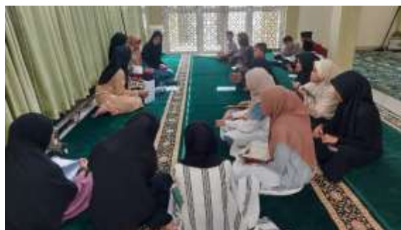
Gambar. 4 Proses lomba ekstrakurikuler tahfiz

Dalam setiap sekali seminggu peserta didik diminta mentasmi' kan atau membacakan hafalan yang sudah dihafalkan kepada guru pendamping agar hafalan tersebut dapat di review kembali oleh guru agar hafalan peserta didik semakin kuat ingatannya. Setiap 2 bulan sekali guru pendamping mengadakan lomba seperti menyambung ayat, menjelaskan kandungan suatu surah, menebak jumlah ayat, membacakan ayat tanpa melihat Al-Qur'an sesuai nama surah yang didapatkan.